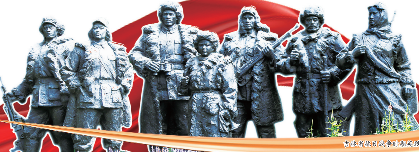
吉林省抗日战争时期英烈雕像