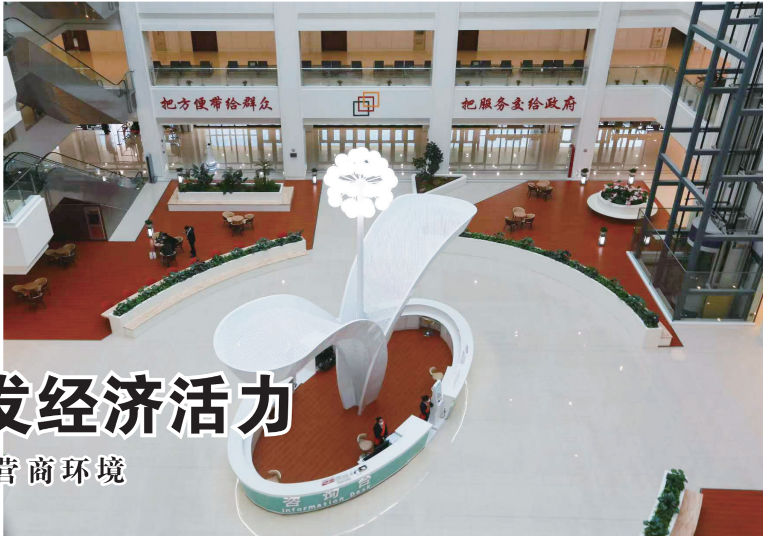
改造后的政务服务大厅功能更完善，布局更科学。

一系列强有力的改革举措为打造更优营商环境，推动全市高质量发展奠定坚实基础。脚踏实地，阔步前行，长春将以更高标准、更大力度、更实举措，打造营商环境新高地，未来，这片具有无限潜力的土地必将越来越热！