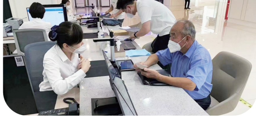
工程项目审批超前指导服务。

重任在肩，初心如磐。面对优化营商环境这一“永不竣工的工程”，长春把责任和担当扛在肩上，把信念和目标刻在心里，一步一个脚印，全力打造东北一流、国内先进、符合国际标准的营商环境。