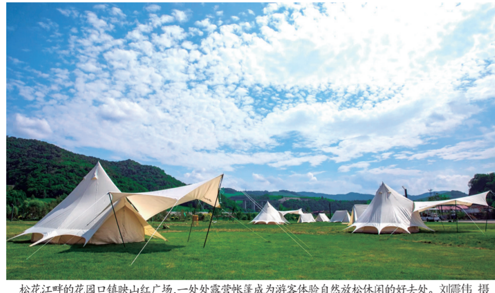
松花江畔的花园口镇映山红广场，一处处露营帐篷成为游客体验自然放松的好去处。