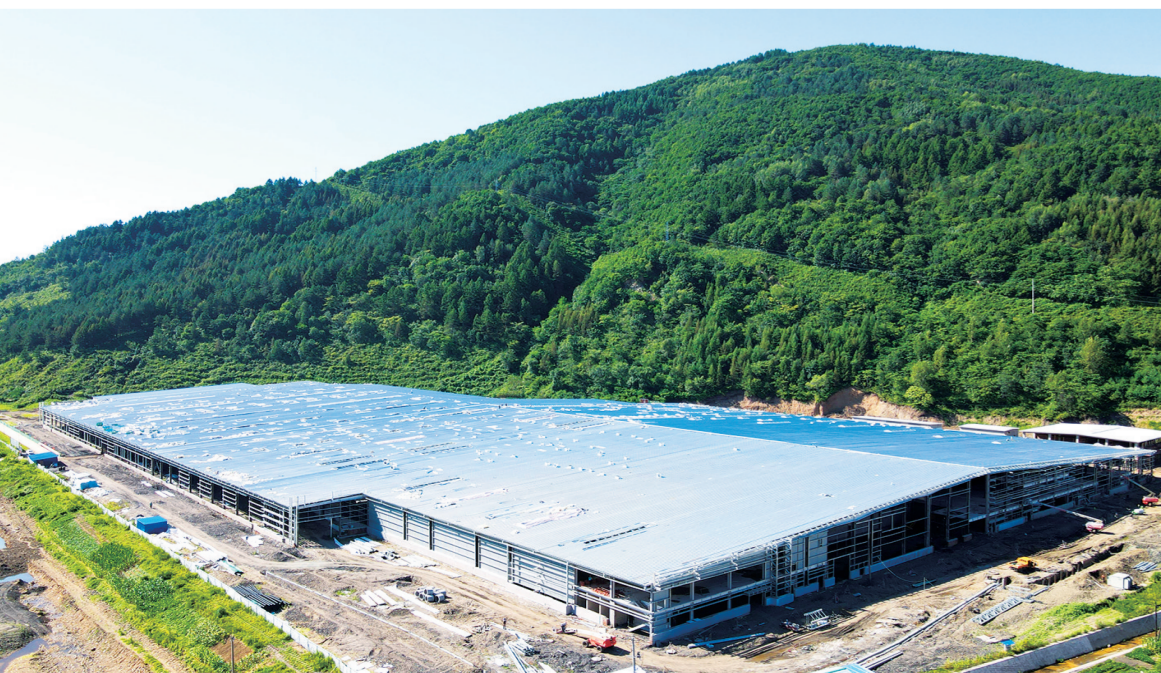
农夫山泉临江公司年产119万吨天然饮用水生产线建设项目施工现场。

务实实效，强化评比考核。制定在建项目、谋划项目、专项项目考核指标，按“五化”模式工作要求，坚持“清单化”管理、“图表化”操作、“模板化”落实，推动项目早落地、早开工、早投产，尽快形成投资增量。通过