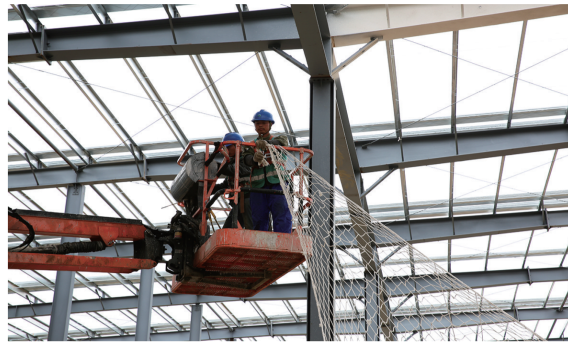
一矿泉水厂房建设。