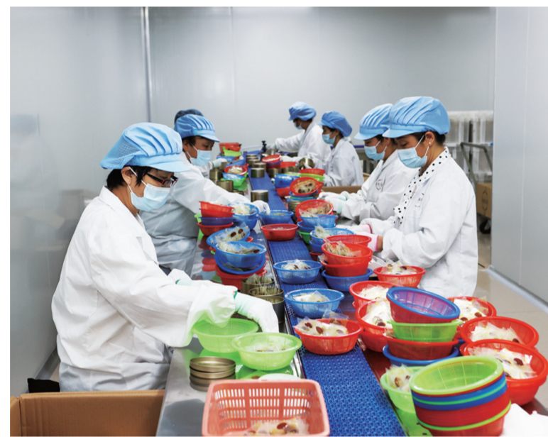
绿色食品生产项目。

点对点，全程跟踪服务。对重点项目进行任务分解，明确目标责任，明确办理时限，定期调度重点项目投入、建设进度等情况。定期深入施工现场，通过实地看进度、分析研究项目建设中遇到的各类突出问题，有针对性地进行分类指导协调解决，并要求项目建设单位合理安排工期，强化施工安全管控。建立5000万元以上重点项目台账，明确项目名称、建设内容、投资规模等内容，协调解决推进过程中遇到的问题和困难，强化持续跟踪，确保农夫山泉二期、鸭绿江城区段生态修复等重点项目顺利推进。