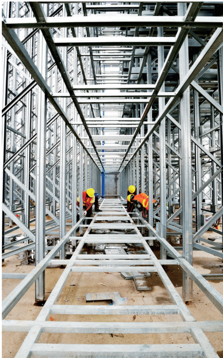
项目建设快马加鞭。

包保机制督促项目进度。在落实重点项目建设联席会议制度的基础上，推动领导干部主动融入项目建设大局，充分发挥示范带动效应，优选全县产业带动能力强、投资拉动作用大、民生改善作用突出的89个优质项目，强化“抓项目就是抓发展”意识，落实“一名县级领导挂帅包保、一个部门跟