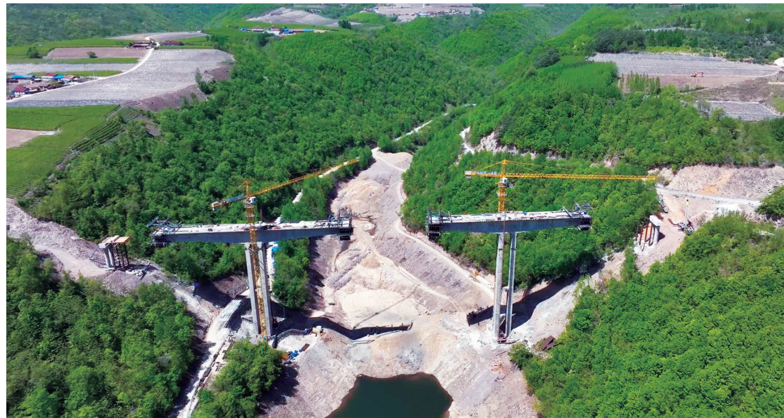
国道丹凤线三道沟至插草段公路改造提升项目。

抓前期，加快进程。在项目服务上做“加法”，加强联动，建立前期服务机制。在项目审批上做“减法”，充分发挥“容缺受理”服务模式，积极与各相关部门通力配合，群策群力缩短审批时间。在解决问题上做“除法”，县