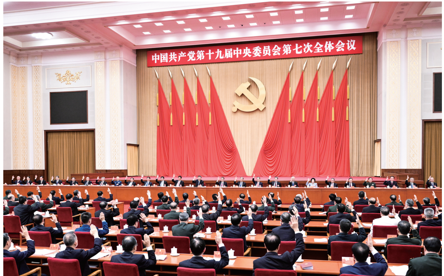
中国共产党第十九届中央委员会第七次全体会议,于2022年10月9日至12日在北京举行。中央政治局主持会议。