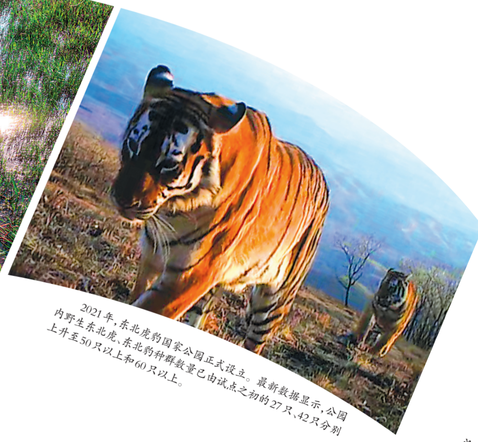
2021年,东北虎豹国家公园正式设立。最新数据显示,公园内野生东北虎、东北豹种群数量已由试点之初的27只、42只分别上升至50只以上和60只以上。