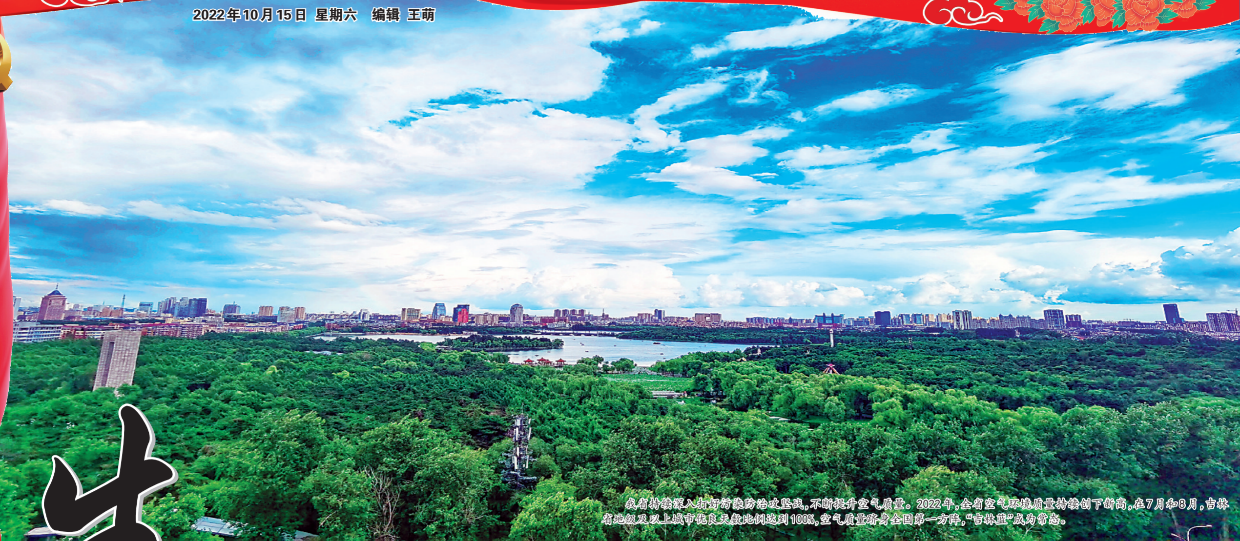
我省持续深入打好污染防治攻坚战,不断提升空气质量。2022年,全省空气质量持续创下新高,在7月和8月,吉林省地级及以上城市优良天数比例达到100%,空气质量跻身全国第一方阵,“吉林蓝”成为常态。