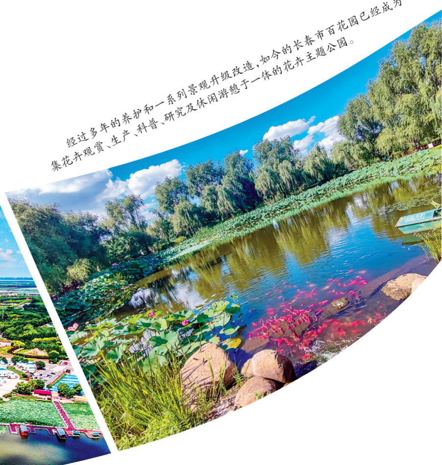
经过多年的养护和一系列景观升级改造,如今的长春市百花园已经成为集花卉观赏、生产、科普、研究及休闲游憩于一体的花卉主题公园。