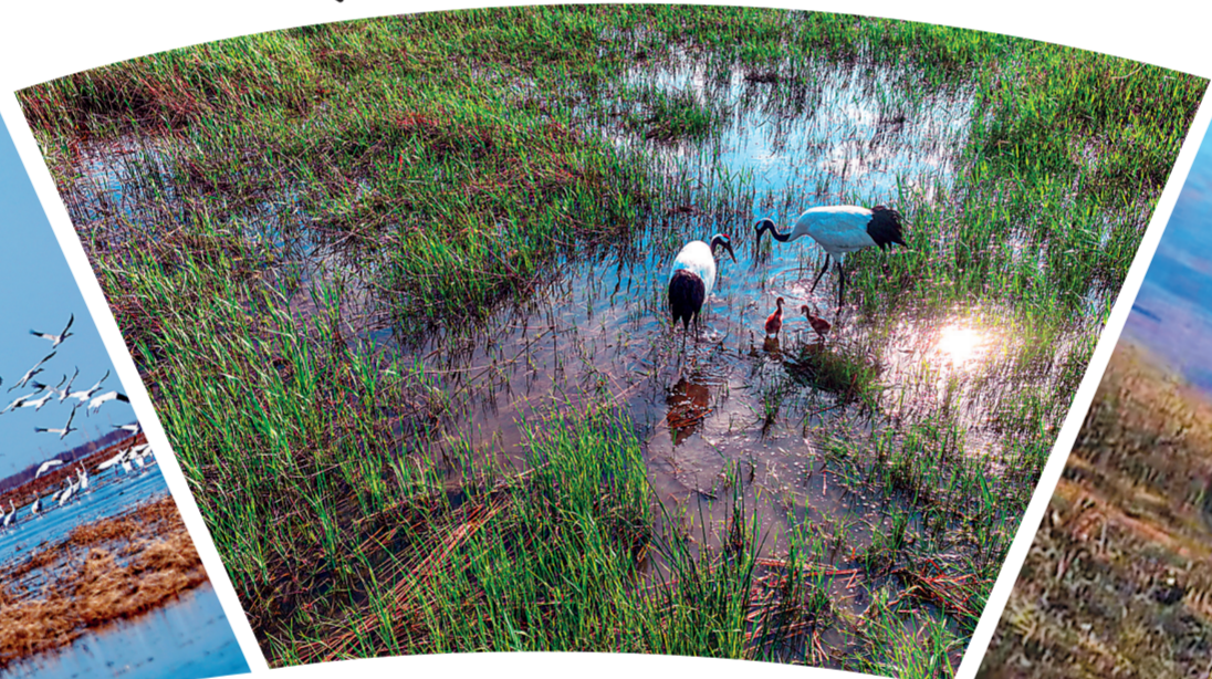
洮南市呼和车力蒙古族乡创业水库水草丰沛,吸引来东方白鹤、丹顶鹤、苍鹭、白鹭等珍稀鸟类筑巢孵化。