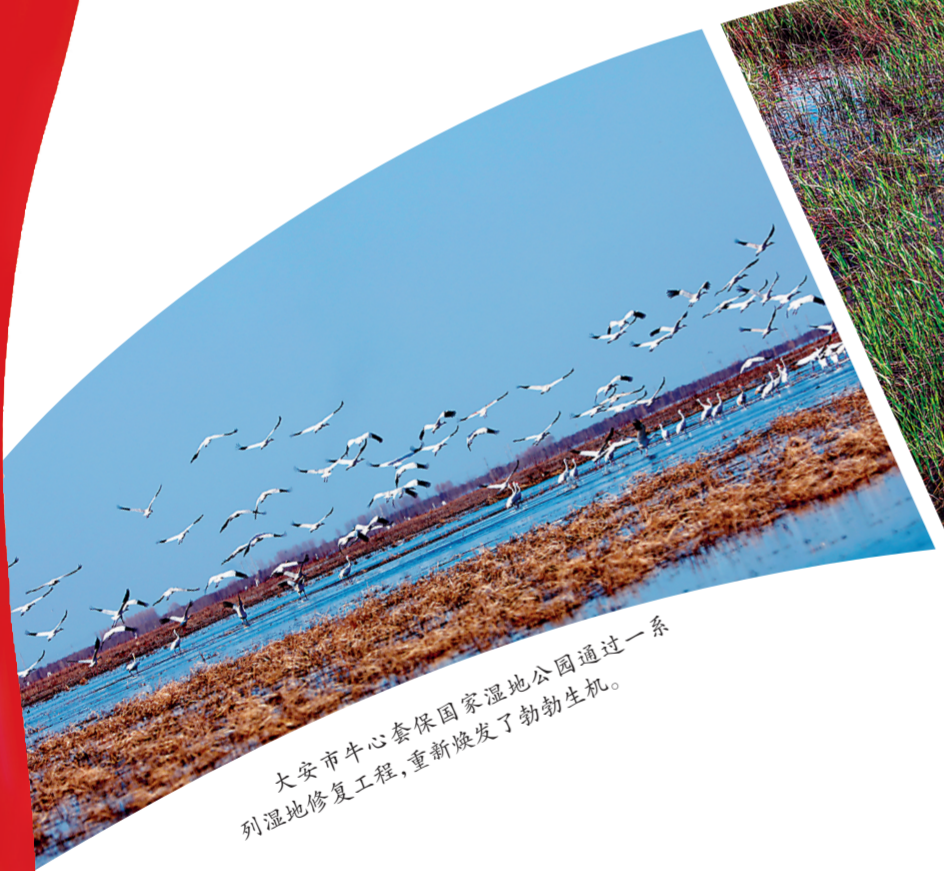
大安市牛心套保国家湿地公园通过一系列湿地修复工程,重新焕发了勃勃生机。