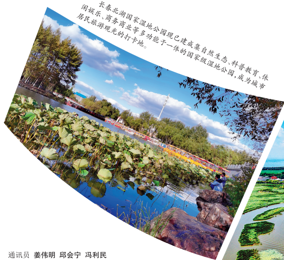
长春北湖国家湿地公园现已建成集自然生态、科普教育、休闲娱乐、商务商业等多功能于一体的国家级湿地公园,成为城市居民旅游观光的打卡地。