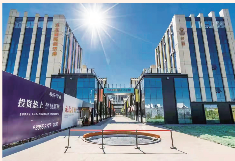
青怡坊国际旅游文创产业园项目B地块已入驻运营京东、阿里、字节跳动等企业。