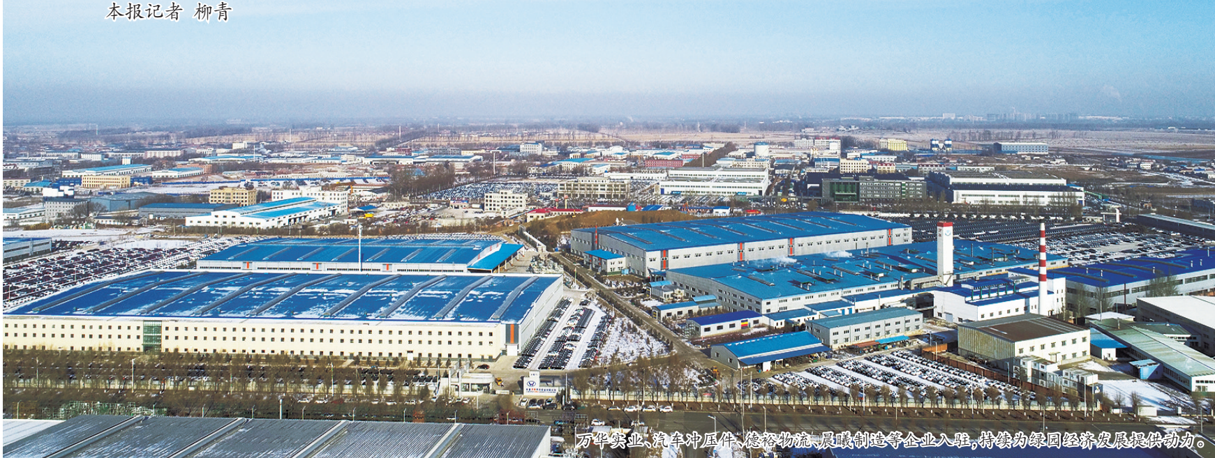
万华实业、汽车冲压件、汽车零部件、装备制造等企业入驻，持续为绿园经济发展提供动力。

——深化“放管服”改革。围绕企业准入到退出“全生命周期”，梳理整合关联性强、需求量大、办事频率高的单一事项，分期分批推出“一件事”服务事项主题套餐，