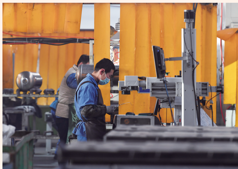
冲压件公司车间有条不紊地开展生产。

扬帆起航风正劲，蓄势奋进涌热潮。从全力推进项目开工复工，到开展线上线下招商活动，从全方位全流程助企服务，到一对一破解发展难题，长春市绿园区以笃行务实的具体行动，深入贯彻新发展理念、融入新发展格局，努力获得更高质量、更高效益的经济发展，为实现长春振兴发展率先突破贡献更大力量。