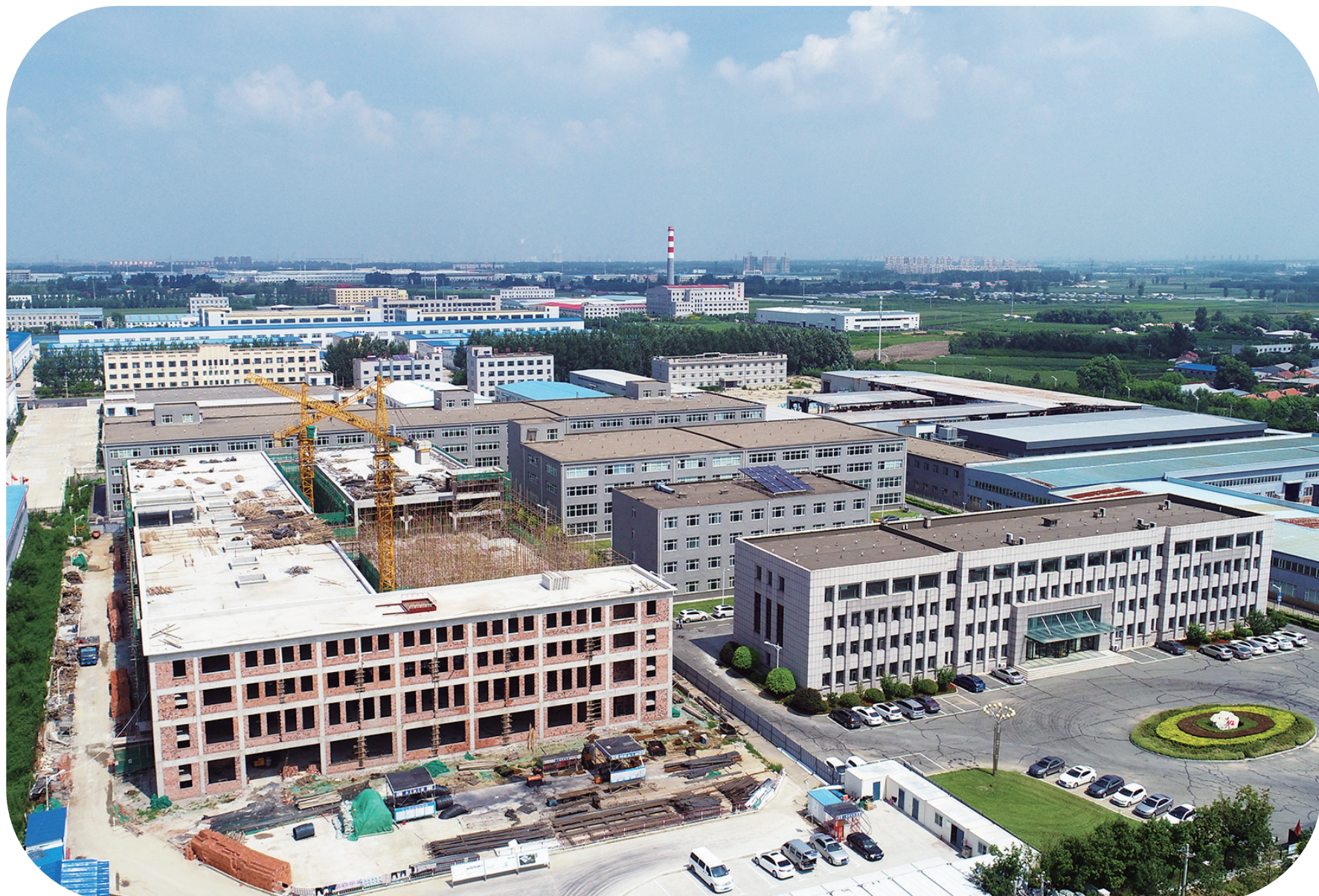
研奥电气续建项目拔地而起。