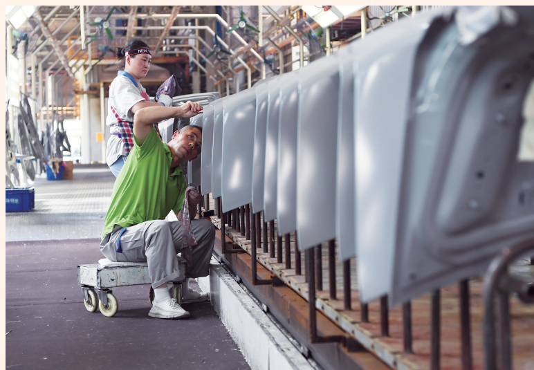
万华生产车间工人正在忙生产。