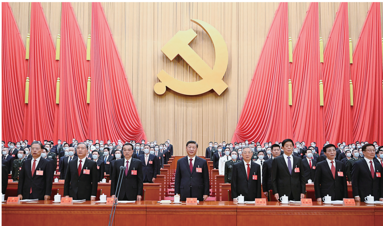
10月16日,中国共产党第二十次全国代表大会在北京人民大会堂开幕。这是习近平、李克强、栗战书、汪洋、王沪宁、赵乐际、韩正、胡锦涛在主席台上。

新华社北京10月16日电 凝心聚力擘画复兴新蓝图,团结奋进创造历史新伟业。举世瞩目的中国共产党第二十次全国代表大会16日上午在人民大会堂开幕。