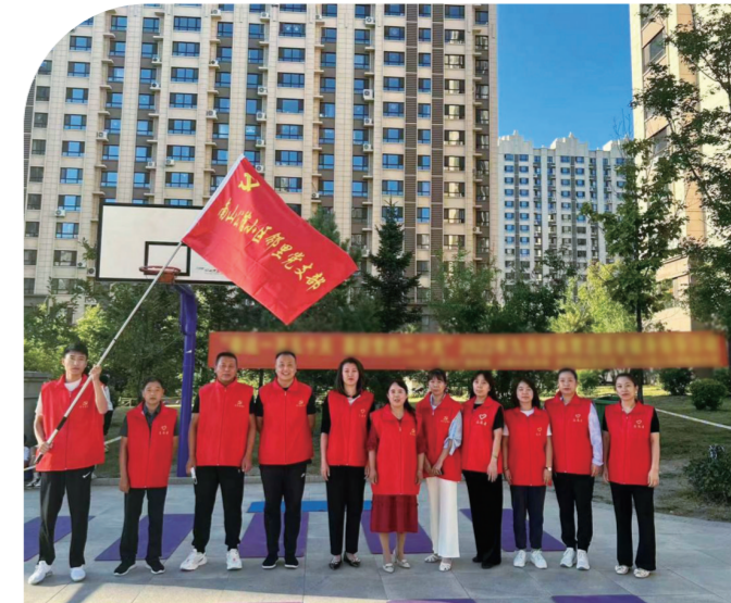
九台区文广旅局联合包保南山公馆小区举办区体育局志愿者健身指导活动。

培养链条，严格流程、压实责任。 积极搭建党员实践平台，深入开展“我为群众办实事”实践活动，组织党员开展“大走访”4.6万余次，兑现“微心愿”3.5万余个，积极解决群众“急难愁盼”问题。特别是在疫情防控等工作中，注重实践锻炼，强化作用发挥，激励引导全市13万余名党员奔赴抗一线，在疫情防控最前沿发挥先锋模范作用。在全市开展“我是党员我先上”行动，成立临时党支部5968个，引导党员干部亮身份、作表率，让党旗在疫情防控一线高高飘扬。 为在全社会营造“争当先进、担当作为”的浓厚氛围，召开“两优一先”表彰大会，表彰555名全市优秀共产党员、优秀党务工作者和先进基层党组织，为3.3万名党员颁发“光荣在党50年”纪念章…… 今日长春，党旗别样红，党徽分外亮。 波澜壮阔回首，敢为人先又续征。站在新的起点，持续发挥引领作用，长春基层党建再谱新篇章。