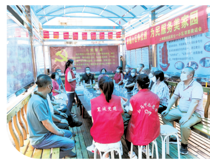
宽城区新发街道上马路社区联合新苑小区邻里党支部开展小区夜话活动。