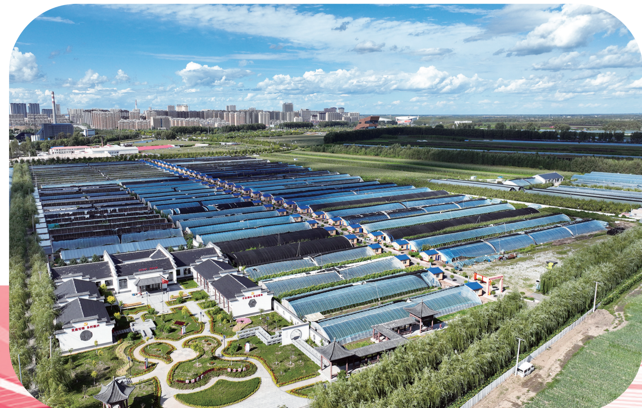
农安县农安镇南关村党支部领办合作社，推动乡村振兴。