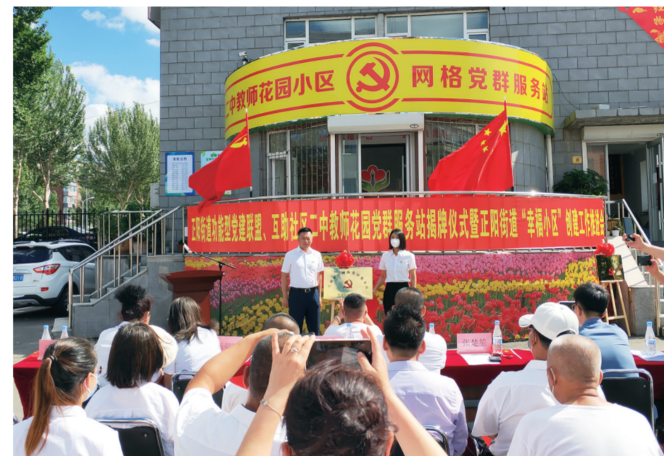
绿园区长阳街道互助社区二中教师花园党群服务站揭牌。

破题新兴领域。长春积极推进新业态新就业群体党建工作，探索成立快递、物流、外卖、电商4个行业党委，推出“十大暖心服务礼包”，指导建设200个“春城驿站”党群服务站，在全省首创“成立实体机构、组建系统型党委、建设智慧化治理平台”等3项举措。先行先试推进楼宇党建示范建设，指导38栋重点楼宇，建立综合党委（总支）和实体楼委会，打造六类楼宇党建新模式，以党建引领楼宇自治、参与共建共治。 创新“双诺一评”。长春开展“双向承诺”，星级评定，制定激励措施6类52项，累计兑现482项，拨付奖励经费280余万元，树起了抓党建促发展的“风向标”。 助企纾困解难。建设3类31个“红色孵化器”，打造“党建+创客+创业+创新”工作模式，助力孵化企业1300余户。组建发展服务团和保企工作队，累计帮助企业解决问题2.8万余个，减免房租4.6亿元，招聘人才2万余人，形成“组团式”“管家式”长春助企服务模式。 夯实基础保障。按照“1+N+X”阵地建设模式，依托县（市）区、省级以上园区以及社会组织，建成党建指导服务中心116个，实现阵地建设体系化。为重点“两新”组织选派党建指导员、“红领专员”265名，开展“两新”党组织书记、党务工作者“万人培训”，培训1.2万余人次，实现队伍专业化。研发全市“两新”组织党建云平台，实现党建信息一网管理、动态更新，实现管理方式信息化云。