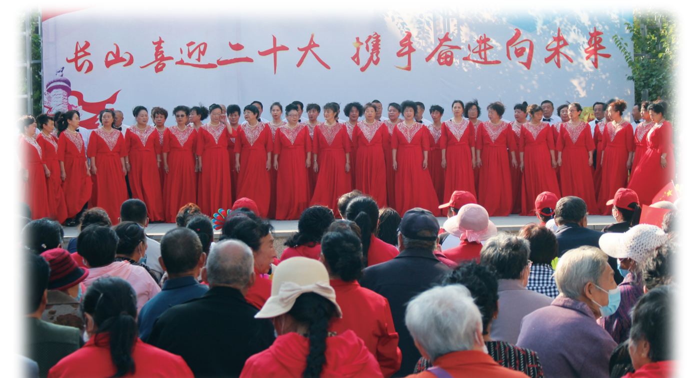
宽城区长山花园社区党委组织开展文艺汇演。