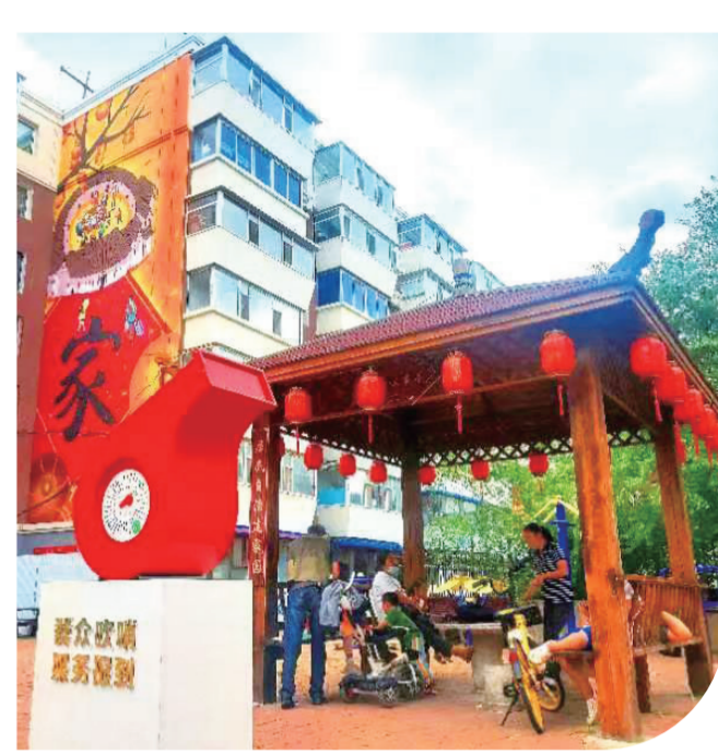
二道区“荣光社·幸福院”自治小区——民丰小区。