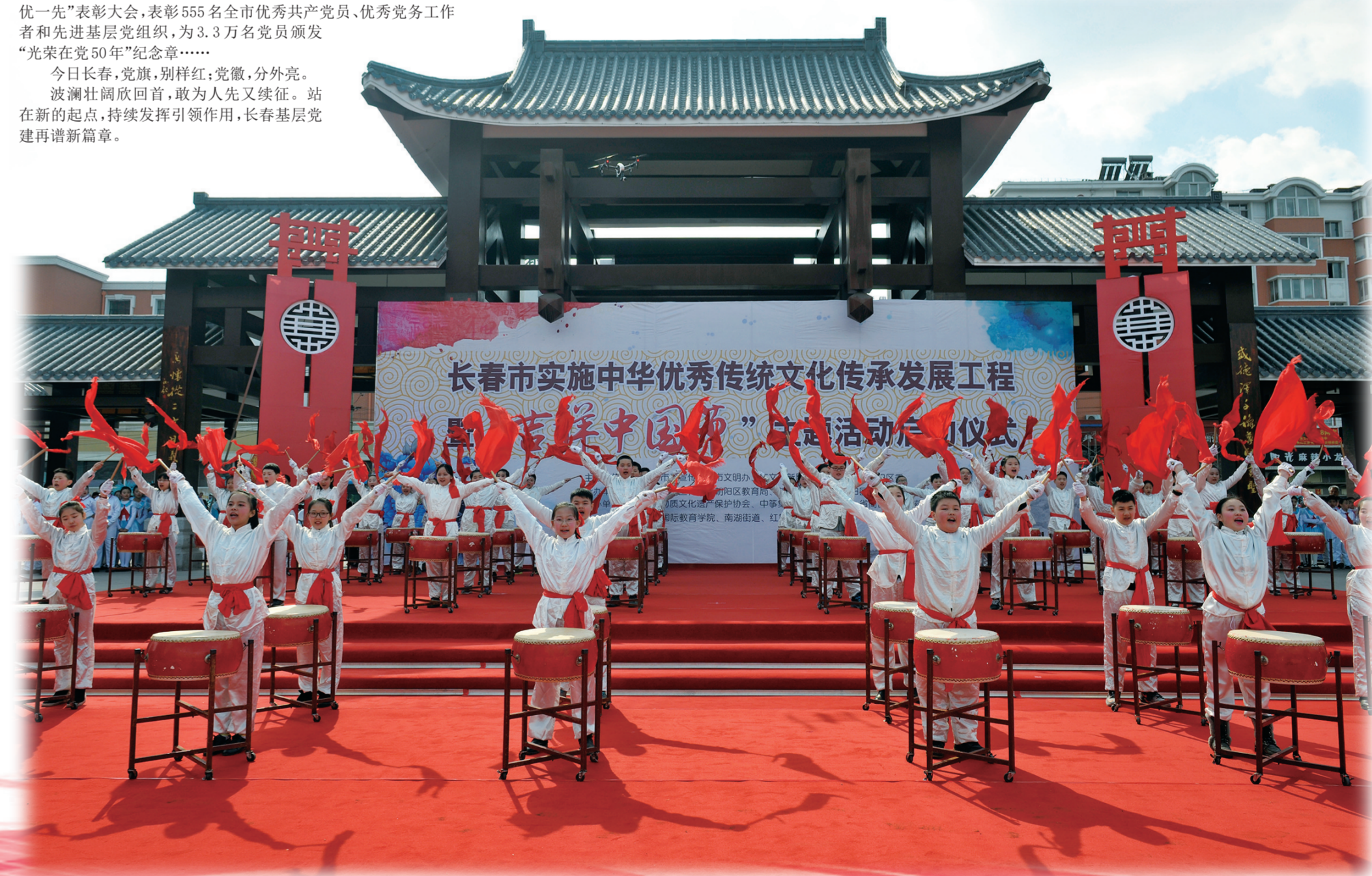
长春市实施中华优秀传统文化传承发展工程“吉祥中国年”主题活动启动仪式在长春德院举行。本版图片为资料图片