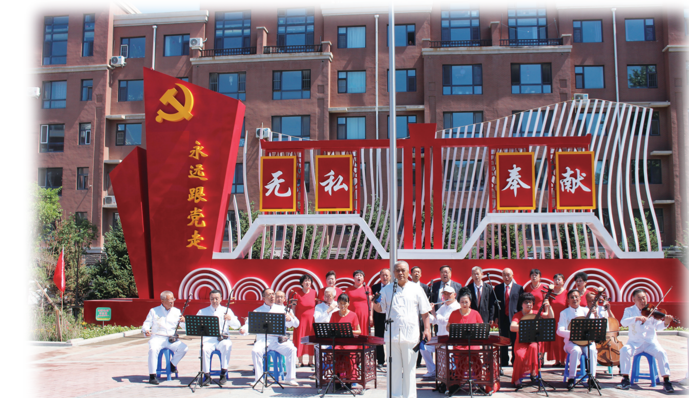
宽城区柳影街道富丰家园小区举办邻里文化节。

风雨洗征程，回踵满堂春。时间卷轴徐徐展开——研究出台城市基层党建升级工程“1+9”系列文件；巩固完善“三长”联动工作机制；创新实施“经济护航”计划，制定“1+8”文件，深化为民服务扎实开展“幸福小区”创建活动…… 长春坚持强基固本，强化系统思维、坚持一体化推进，持续推动党的组织优势转化为发展优势，转化为基层治理效能，努力走出一条科学高效、务实管用、独具特色的基层党建新模式，为全市振兴发展提供了坚强的组织保障。