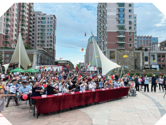
朝阳区红旗街道在长影世纪村举办“创建幸福小区 建设最美家园”启动仪式，活动现场放飞“幸福纸飞机”。

紧盯发展瓶颈，长春推动全市非公企业和社会组织“两新”党建工作创新突破，提质增效。 深化党的组织和工作“两个覆盖”，释放强大组织力。长春连续三年开展“两个覆盖”集中攻坚，突出行业党建、联盟引领、龙头带动，全市非公企业和社会组织党组织组建率分别提高27%和31%。