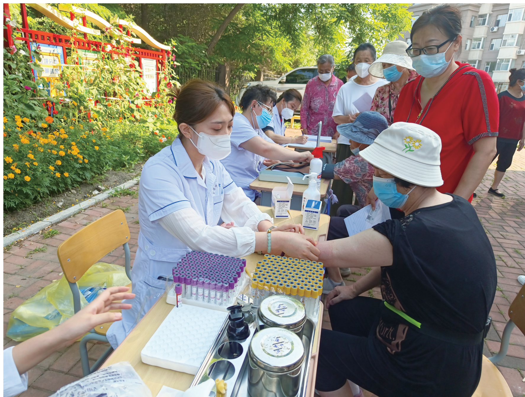
在“红医走基层”活动中，医护人员正在为馨民小区居民诊疗。

组织延伸，提升基层治理水平。构建社区—网格（小区）—楼栋—单元分级负责、一插到底的基层组织和疫情防控网络，推动建立小区（网格）党支部3200个，功能型小区党支部3890个。巩固完善“三长”联动工作机制，推动各级机关企事业单位在职党员开展“双报到”、担任兼职“三长”，进一步加强基层治理力量。打造“红色物业”项目110余个，积极破解群众关心关切的物业管理难题，切实提升群众幸福感、满意度。推动建立小区（网格）党群服务站1400余个，逐步形成全域覆盖、布局合理、功能完备的城市