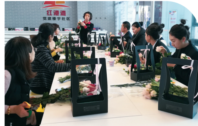
南关区红港湾党建楼宇社区开展主题活动。