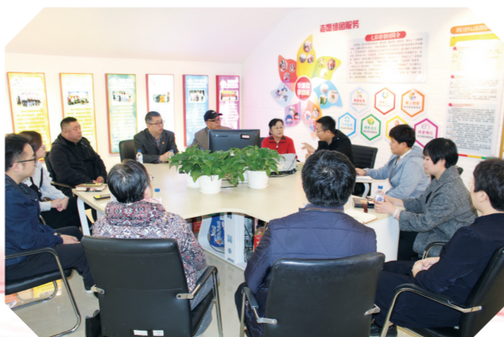
南关区九圣祠社区党委邀请街道、社区、居民三方有关人员共同商讨“功能型”物业服务事宜。