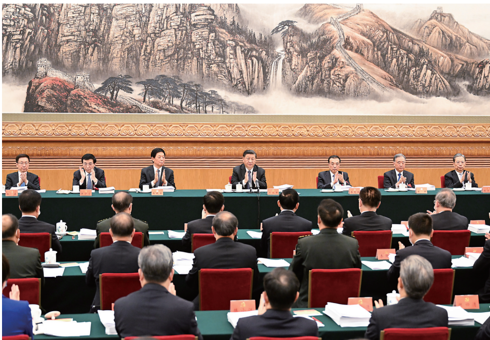
10月18日,中国共产党第二十次全国代表大会主席团在北京人民大会堂举行第二次会议。习近平、李克强、栗战书、汪洋、王沪宁、赵乐际、韩正等出席会议。

新华社北京10月18日电 中国共产党第二十次全国代表大会主席团18日下午在人民大会堂举行第二次会议。习近平主持会议。 会议通过了将关于十九届中央委员会报告的决议(草案)、关于十九届中央纪律检查委员会工作报告的决议(草案)