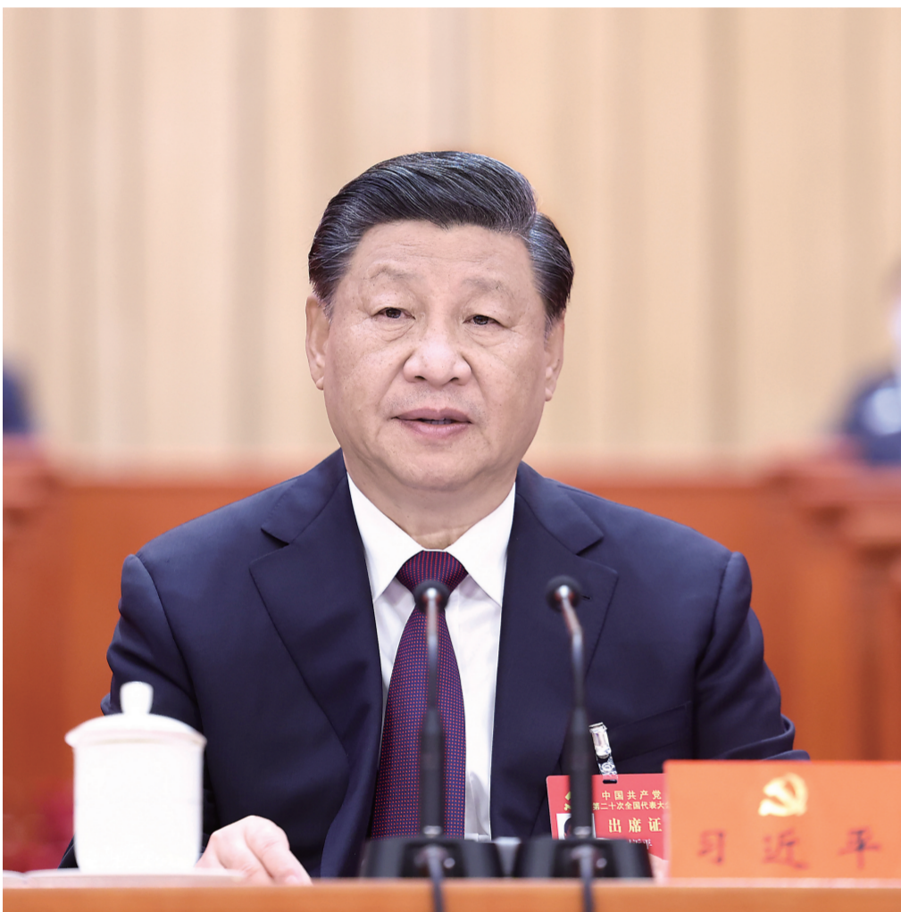
10月22日,中国共产党第二十次全国代表大会在北京人民大会堂胜利闭幕。习近平同志主持大会。

习近平强调,中国共产党走过了百年奋斗历程,又踏上了新的赶考之路。一百年来,党团结带领全国各族人民取得了新民主主义革命、社会主义革命和建设、改革开放和社会主义现代化建设的伟大胜利,开创了中国特色社会主义新时代。百年成就无比辉煌,百年大党风华正茂。我们完全有信心有能力在新时代新征程创造令世人刮目相看的新的更大奇迹。全党要紧密团结在党中央周围,高举中国特色社会主义伟大旗帜,坚定历史自信,增强历史主动,敢于斗争、敢于胜利,埋头苦干、锐意进取,团结带领全国各族人民为实现党的二十大确定的目标任务而奋斗