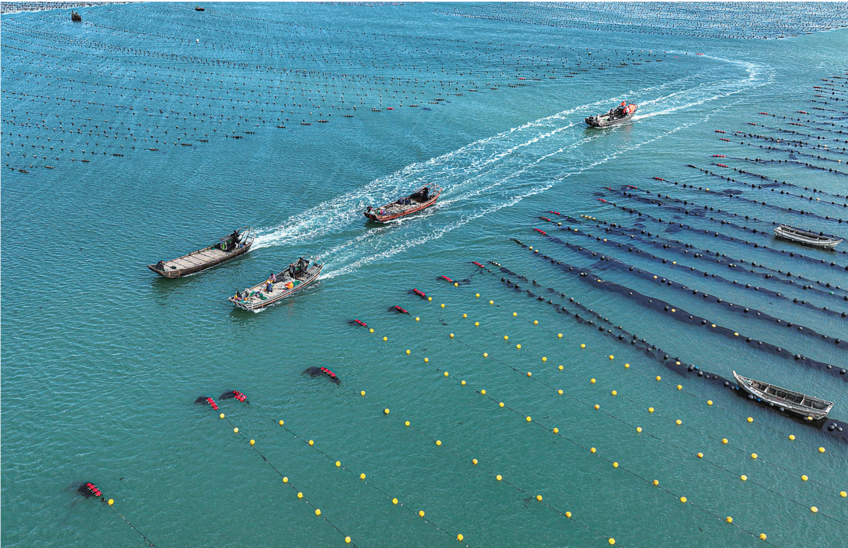
11月1日,在山东荣成俚岛湾海洋牧场,渔民驾驶渔船前往养殖区作业(无人机照片)。连日来,在山东省荣成市各大海洋牧场,渔民驾驶渔船进行水产品收获作业,海上一派繁忙景象。