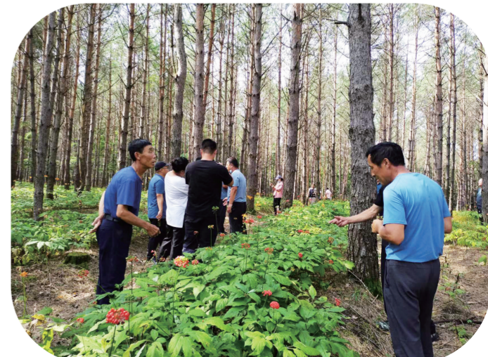
靖宇县充分利用丰富的森林资源,大力发展林下参产业。(资料图片)

提升发展水平,打造产业亮点。今年5月,靖宇县争取到农业农村部“靖宇林下参”地理标志农产品保护工程项目,目前正在实施。该项目将通过改善示范基地生产环境、培育区域特色品种、提升产品品质、强化品牌策划宣传、强化可追溯体系建设、推进全产业链标准化等六个方面提升“靖宇林下参”的建设水平。同时有4户林下参栽培企业申报了国家绿色食品认证,提升产品档次。