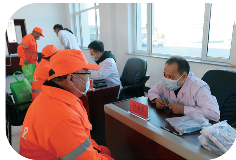
白山市总工会积极开展义诊活动,关爱环卫工人。

“通过参加劳动,让我们感受到了一线环卫工人的辛苦和不易,我们要做到文明出行、不乱扔垃圾,为干净整洁的环境贡献自己的力量。”来自市直机关的80余名党员干部参加“我当一天环卫工人”主题实践活动,他们从环卫工人手中接过扫帚、垃圾袋、手套等保洁工具,换上环卫服装,正式进入角色,共同建设幸福美好新白山。