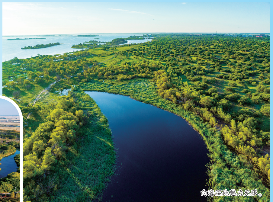
向海湿地魅力无限。