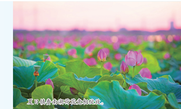
夏日镇南湖畔荷花竞相绽放。