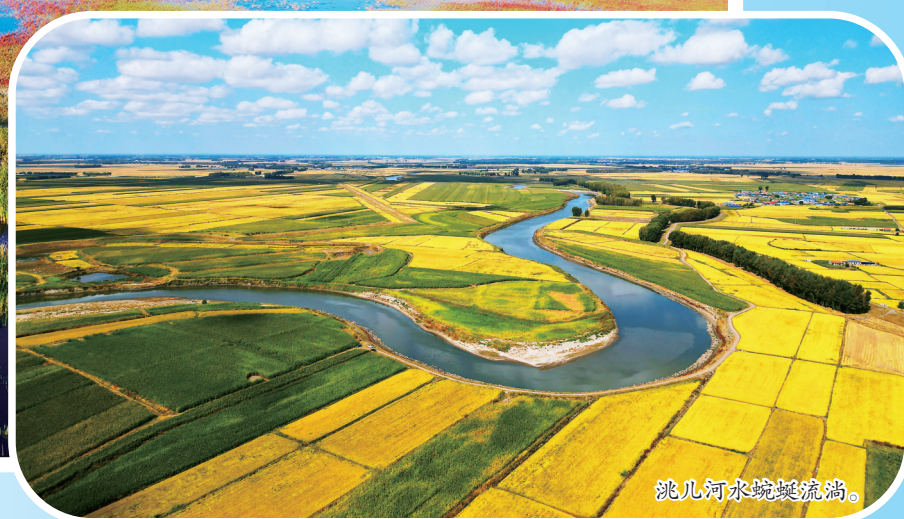
洮儿河水蜿蜒流淌。