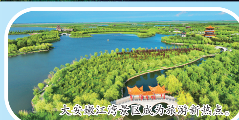
大安嫩江湾景区成为旅游新热点。