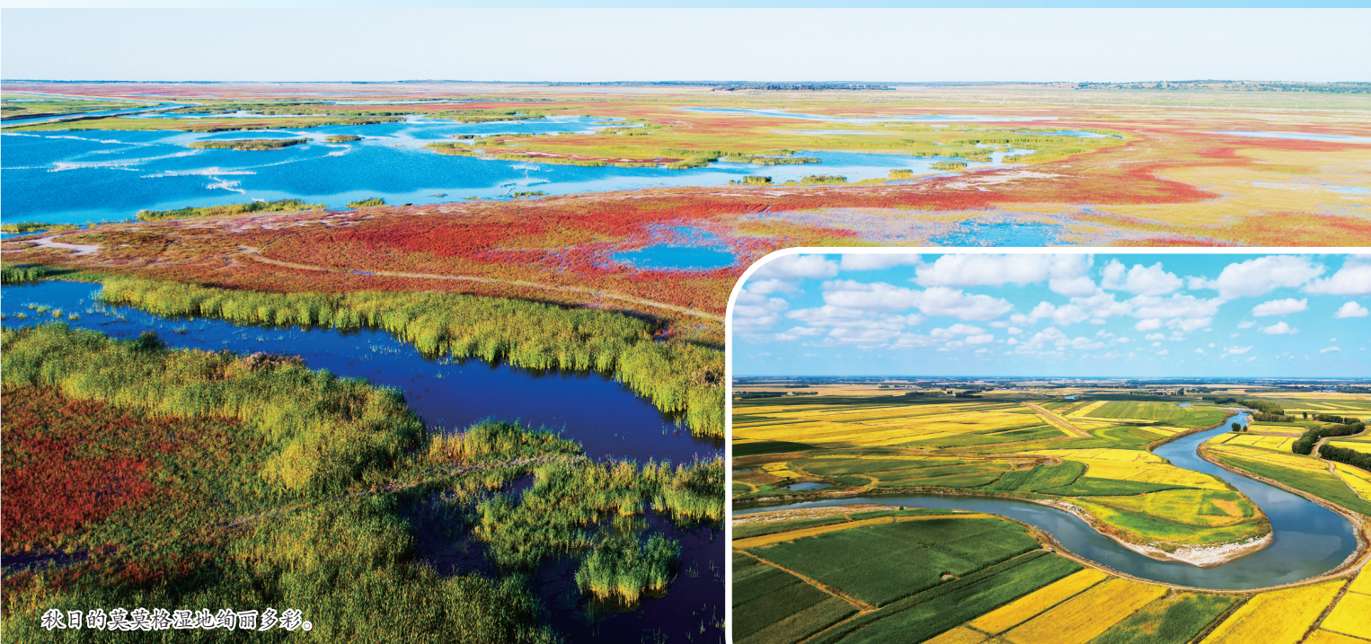
秋日的洮儿河湿地绚丽多彩。

白城市河长办还深入机关、企业、乡村、社区、公共场所,采取群众喜闻乐见、通俗易懂的方式和途径开展宣传,引导群众知晓、关心、支持和监督河湖长制工作。积极引导公众参与知水、节水、护水、亲水活动,倡导群众从身边小事做起,共同参与河湖环境治理,增强群众的爱河护河观念和生态保护意识。