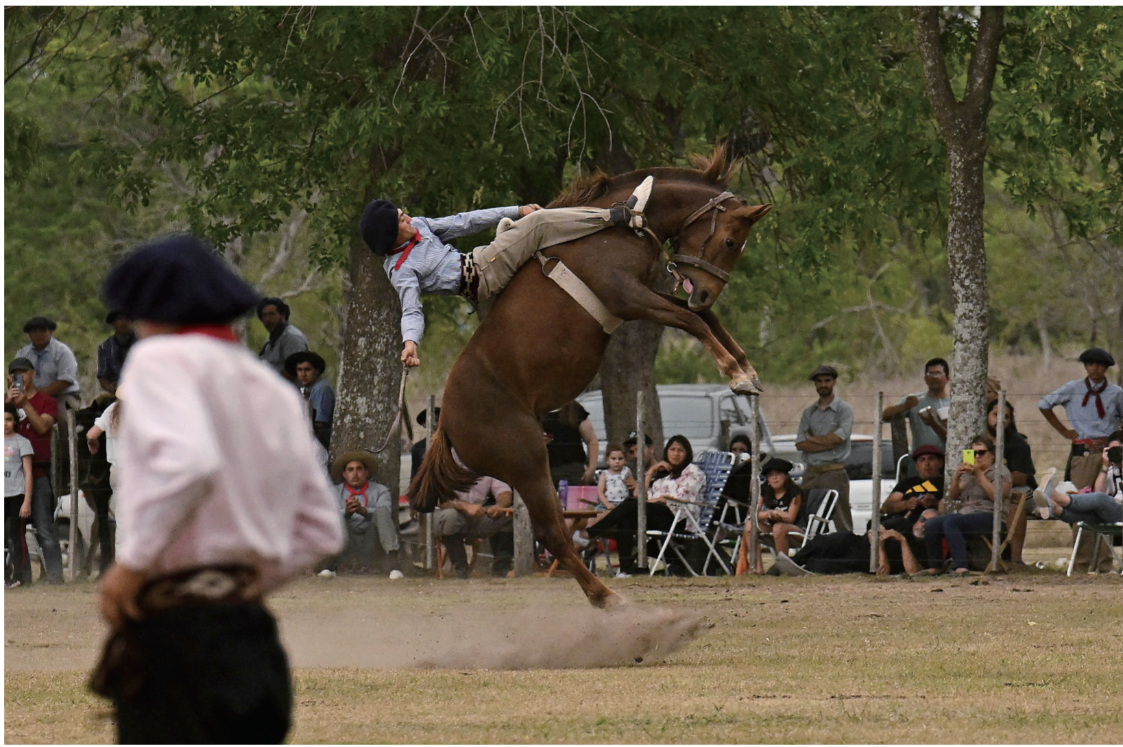
11月12日，在阿根廷布宜诺斯艾利斯省北部的圣安东尼奥雷科镇，一名高乔牧人正在表演驯马。当天，阿根廷游牧民族高乔人庆祝“传统日”，这一节日旨在保存和传承高乔人的传统游牧文化。