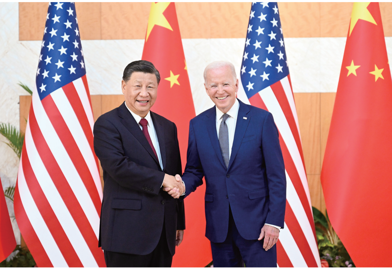
当地时间11月14日下午,国家主席习近平在印度尼西亚巴厘岛同美国总统拜登举行会晤。新华社记者 李学仁 摄

新华社印度尼西亚巴厘岛11月14日电(记者白林 倪四义 刘华)当地时间11月14日下午,国家主席习近平在印度尼西亚巴厘岛同美国总统拜登举行会晤。两国元首就中美关系中的战略性问题以及重大全球和地区问题坦诚深入交换了看法。