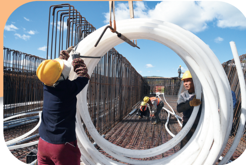
建设者加紧施工。