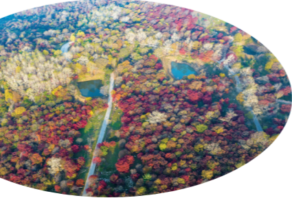
“四好农村路”带动乡村旅游。