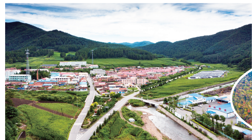
“四好农村路”。

全要素全周期,公路工程助力乡村振兴。建立以质量为核心的信用评价体系,该市同步推行重点农村公路信用评价体系,推动农村公路发展从规模速度型向质量效益型转变。建立科学规范制度文件,完善技术标准、智慧监管平台信息技术,提升农村交通设施全要素、全周期数字化管理水平。守住安全线,严格落实农村交通安全设施与道路建设主体工程同时设计、同时施工、同时投入使用制度,扎实开展安全“消危”行动,推进村道安全生命防护等工程,大力推行“七公开”制度,建设阳光工程、廉洁工程助力乡村振兴。