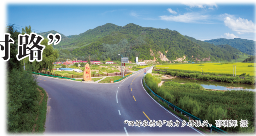
“四好农村路”助力乡村振兴。邵明辉 摄

落实主体责任,公路管理迈出新步伐。在建设“四好农村路”过程中,市、县两级加强政府引导,确保部署落实到位。对照任务列表,将农村公路建设列为市政府重点工作,列入目标责任清单及民生实事任务中,明确责任领导、部门