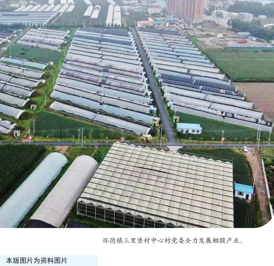
怀德镇三里堡村中心村党委全力发展附属产业。