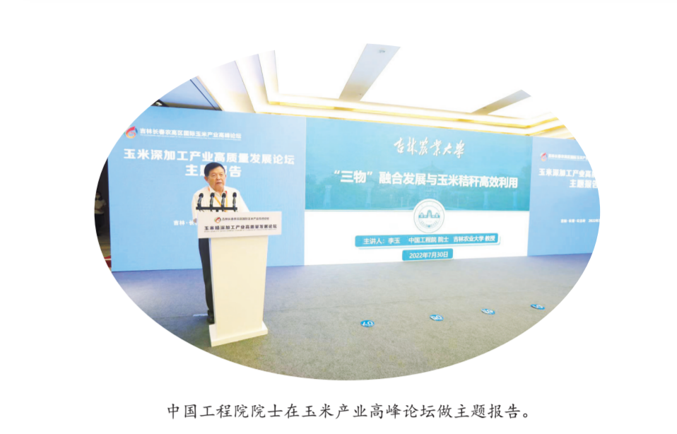
中国工程院院士在玉米产业高峰论坛做主题报告。

功以才成，业由才广。今年以来，公主岭市聚焦长春农高区建设，以“外引+内育”“政策+服务”“产业+人才”多措并举，打造农高区人才建设新高地，激发创新活力，释放集聚效应。 开展“乡村能人”职称评选工作，126名高素质农民、合作社带头人拿到职称。农高区内高新技术企业设置科研助理岗位8个，8名省农科院研究员到市科技局、农业农村局、部分乡镇挂职锻炼。 在公主岭市以“1+3”人才政策矩阵，汇聚高层次人才政策，包括农高区人才集聚政策、乡村振兴人才政策和急需紧缺人才政策，在创业扶持、待遇保障、市场作用等方面实现突破升级。 创业扶持方面，在省和长春市政策基础上，全市对院士创业再给予最高500万元项目资助，两年内给予20万元生活补贴。对实现科技成果转化和产业化的，再给予15%的配套奖励。待遇保障方面，在省、长春市政策的基础上，发放给博士、硕士、本科生5万元、3万元、2万元安家补贴，各类士、硕士15万元、7万元生活补贴，增加高层次人才吸引力。在公主岭购房的，分别给予本科生、硕士生、硕士生5万元、10万元、15万元购房补贴。 开展服务升级行动，组建企业人才服务专班，131名服务专员每月深入企业服务人才需求。组建科技成果转化跟踪服务专班，建立省内高校和科研院所重点联系目录，与16个科技成果转化对接联系。 开展人才走访行动，编制国内外专家人才目录，围绕种子产业和玉米产业，搜集整理200余名专家人才、与48名专家取得联系，并持续跟踪。