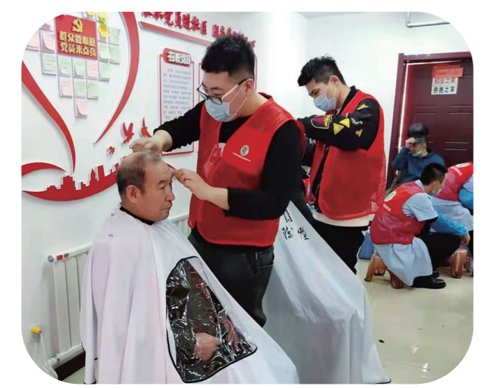
河北街道农场社区兑现群众“微心愿”。