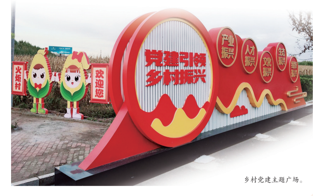
乡村振兴主题广场。

风雨洗征程，回眸党建红。打开时间的卷轴，公主岭市用一串串数字、一个个实绩、一桩桩好事，清晰地描绘出组织工作的鲜明底色。 靶向发力，精准施策，开展群众活动1430次，兑现群众微心愿2318个，解决急难愁盼问题384个，加快创建“幸福小区”；建立“三级响应”做实应急指挥机制，梳理4大类23项常见的应急事件，全市101家单位全部定点包保420个点位，“吹哨”办好群众事……今年以来，公主岭市坚持以组织体系建设为重点，强基固本，把党的基层组织建设工作贯穿全过程，在体制机制上破立并举、积蓄势能，各领域基层党组织的政治功能和组织力不断增强，发挥了重要的“压舱石”和“定盘星”作用。 致广大而尽精微。公主岭广大领导干部始终保持战略定力和耐心，勇于自我革命，赢得发展主动。 凝聚聚力，攻坚突破。从无到有、连点成线、织线成网，一个个“战斗堡垒”矗立在基层，一批批“红色先锋”活跃在基层，一面向鲜红的