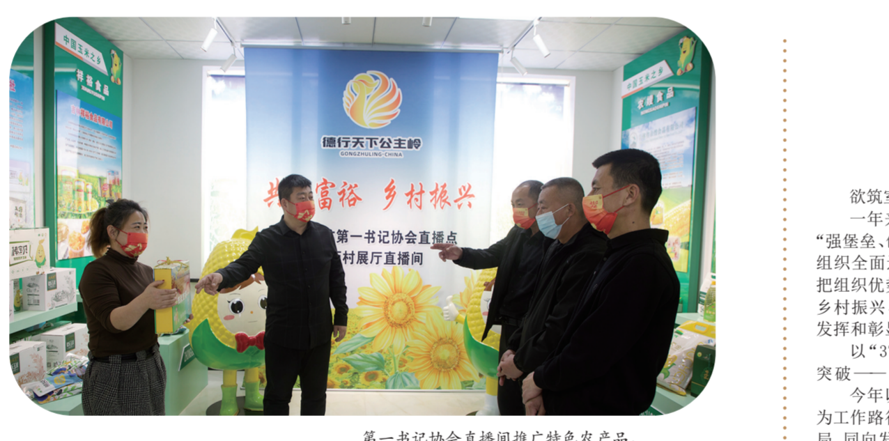
第一书记协会直播推广农产品。