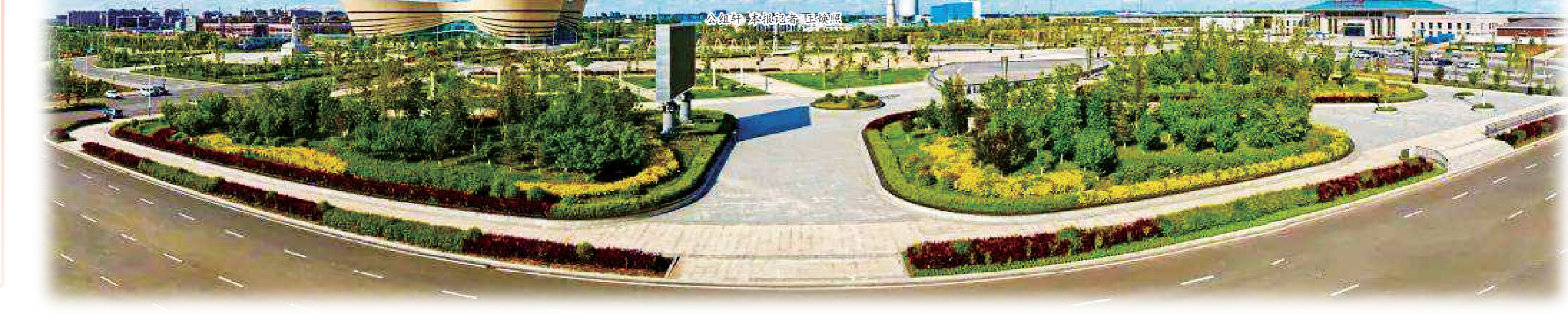
公主岭市科股论争 环城路