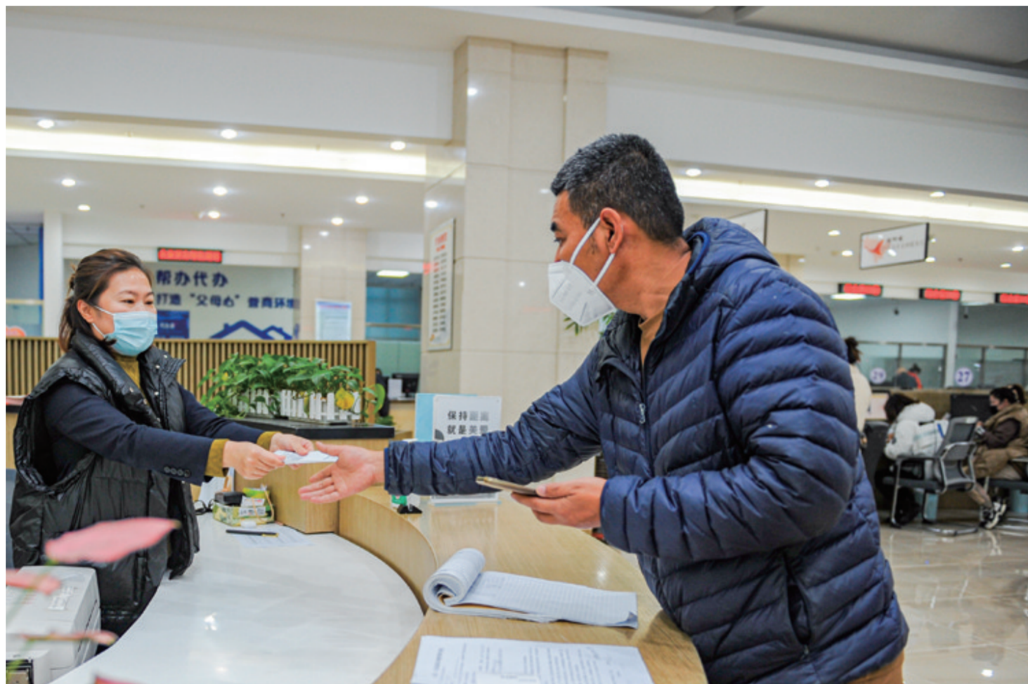
为贯彻落实党的二十大精神，日前，梅河口市政务服务中心开展午间不间断服务，周六错峰服务，为市民提供便利。图为居民正在办理业务。

深怀爱民之心，恪守为民之责，为困难群众代言，为困难群体发声，让百姓获得感成色更足、幸福感更可持续、安全感更有保障。无论寒冬盛夏，“救助”永远在岗尽职，这就是救助工作人员内心最坚定的信念。