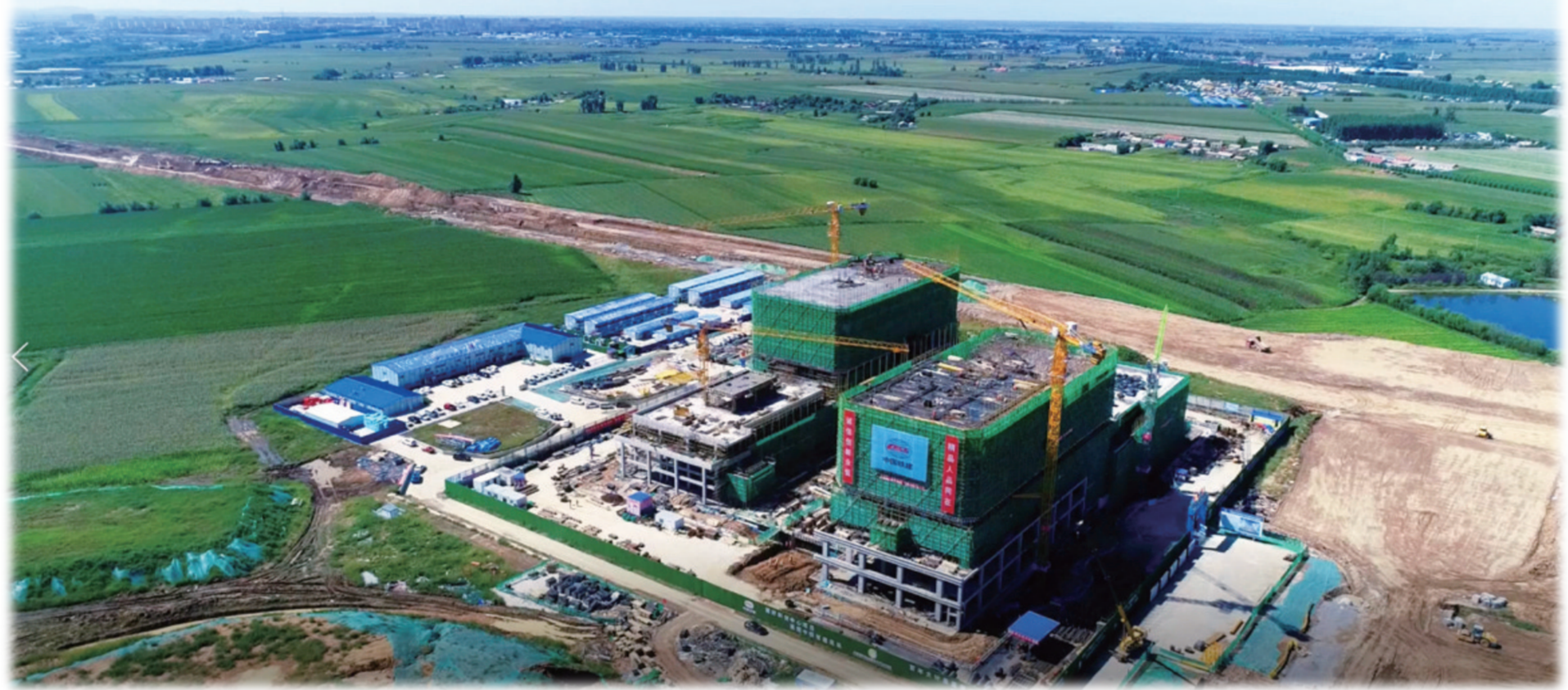
公主岭市长春国家农高区科创中心主体结构封顶。

长春市委鲜明提出，“推动吉林全面振兴取得新突破”“开创长春振兴发展率先突破新局面”，宣示了新时代新征程的使命任务，为公主岭市发展指明了前进方向。细读公主岭市政府工作报告，凸显出“务实”态度。一句句围绕发展的阐述，一项项增进人民福祉的部署，将振兴发展的宏大叙事具象为每个个体对美好生活的期待与追求。全年开工5000万元以上项目80个，吸纳高层次人才800人以上，完成就业培训5000人，完成35个老旧小区改造，向着种业产值20亿元以上进军……新的一年，公主岭接续奋斗，再创新程。 再出发，超越是公主岭不变的追求—— 东北振兴有我，在波澜壮阔看岭城。对于公主岭来讲，推动经济高质量发展从来就不是一句空话，它始于足下，发于内心。接下来，食品产业、装备制造、现代物流、种子、文旅、医药“六业并举”，产业格局的谋划将转变为经济发展的新动能……新时代，公主岭机遇无限，空间无限。 振兴路上，越是艰难险阻，越需要坚如磐石的发展定力和勇气。如今，公主岭市的格局正在形成，发展后劲充足，发展前景可期。 长河浩荡，势不可挡。站在新的发展起点，公主岭市上下将深入学习贯彻党的二十大精神，进一步凝聚起高质量发展发展的磅礴力量，撸起袖子加油干，为建设长春现代化都市圈新型中等城市而不懈奋斗，再创新程。