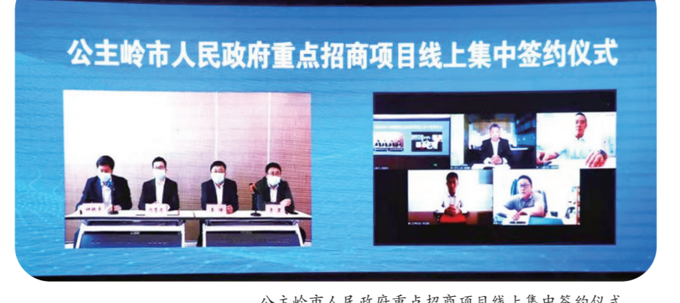
公主岭市人民政府重点招商项目线上集中签约仪式。

这一年，在坚持中赢得战略主动，农高区建设全面启动。4月19日国务院正式批复，在省、市领导高度重视下，5月31日隆重揭牌。全力实施“1355”发展战略，坚持高点谋划、高标准建设、高效率推进。与中国农科院等15家科研单位深度合作，设立3家院士工作站，成功举办国际玉米产业高峰论坛，5位院士做主旨演讲，9位专家做专题报告，圆满完成“一县一业”、黑金粮仓科技会战等30个科研项目年度课题。科创中心主体封顶，农业东路等3条主干路具备通车条件。总投资89.4亿元5个产业项目开工，食品产业园17栋厂房进展顺利，先正达中国春玉米创新中心主体工程完工，国内规模最大、技术最先进的鸿翔种业加工厂房投产。 这一年，在高质量发展上积极作为，经济发展韧性增强。全市开工5000万元以上项目78个，红旗中心库等26个项目建成投产。吉林交通职业技术学院等38个项目成功签约；天威电线束、精诚科技当年落户即投产。筑产“六业并举”产业架构，沈阳来金等16个美国PPE配套项目进展顺利；坤圣园等4个农产品加工项目扎实推进；隆平高科等3个种业研发企业成功落地；文体综合服务中心等6个重点文旅项目稳步实施；圣马、峻达整车物流建成投产，大岭镇汽配小镇吉林省现代服务业集聚区，范家屯汽配智造小镇获评吉林省第四批特色产业小镇。营商环境持续优化，为3.6万户市场主体补贴1492万元，办理留抵退税5.76亿元，新增“四上”企