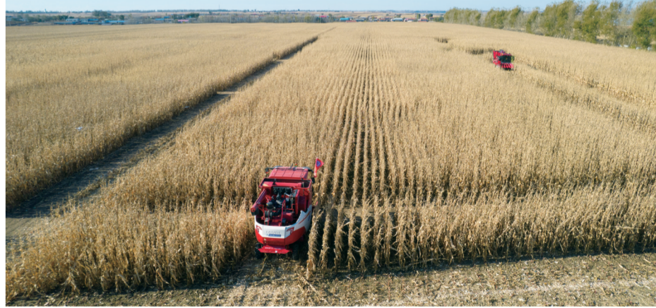
千亩无人农场获丰收，智慧赋能增效。

壮阔的征程，需要领航的力量。伟大的事业，必须以党建为引领。 打铁还需自身硬。2023年，公主岭市将全面加强自身建设，加强学习，确保绝对忠诚。深入学习宣传贯彻党的二十大精神，坚决维护习近平总书记党中央的核心、全党的核心地位，坚决维护党中央权威和集中统一领导，坚决拥护“两个确立”，增强“四个意识”、坚定“四个自信”、做到“两个维护”，不断提高政治判断力、政治领悟力、政治执行力，坚决在思想上、政治上、行动上同以习近平同志为核心的党中央保持高度一致。 求真务实，锻造过硬作风。发扬“严严实实”作风，坚持“五化”工作法，真正做到说了算、定了就干、干就干好。坚决落实市委“干净、专业、廉洁”要求，全面提升政府系统干部专业精神、专业思维、专业素养，让实干担当成为政府的鲜明底色。 尊崇法治，做到依法行政。加强重大行政决策事前论证和事后评估，做到行政决策程序合法性审查全覆盖。依法接受人大法律监督，自觉接受政协民主监督，主动接受纪检监察、审计监督、社会监督，办好人大代表建议和政协委员提案。 严守底线，建设廉洁政府。人民政府头上顶着“人民”二字，政府公职人员清廉用权是本分也是天职。要严守政治纪律、政治规矩，从我做起，从政府班子做起，带动政府系统各级领导干部以上率下、正己率人，知敬畏、存戒惧，堂堂正正做人、干干净净做事。 奋斗，是公主岭市靓丽夺目的时代底色；党建，是公主岭市生不息的精神力量。党的旗帜，在公主岭市高高飘扬；党的领导，在公主岭市熠熠生辉；党的伟力，在公主岭市充分彰显。新征程上，全市上下“大干快上”不断弘扬的光荣传统和优良作风，坚持不断将党的建设引向深入、坚定不停推进全面从严治党，以好的作风振奋精神、激发斗志、树立形象、赢得民心，凝聚起全市人民的磅礴力量，风雨无阻向前行，同心共筑岭城梦。