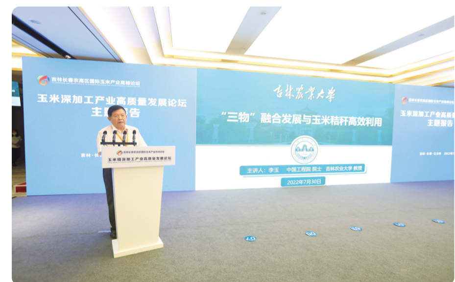
中国科学院院士在玉米产业高峰论坛做主题报告。

凌云纵笔起长卷，华笔妙墨写宏篇。2022年，是党和国家历史上具有里程碑意义的一年，也是公主岭发展史上极不平凡、砥砺奋进的一年。全市上下一心，勇担使命、奋起争先，推进各项工作取得新成效，书写了亮眼答卷，展现了活力奔涌的新气象。 2022年，公主岭市在市委、市政府的坚强领导下，全市上下高举中国特色社会主义伟大旗帜，深入贯彻落实“疫情要防住、经济要稳住、发展要安全”总要求，坚定实施“1126”发展战略，经济高质量发展迈出新步伐。预计全年实现固定资产投资98亿元，地方级财政收入16.1亿元，规上工业总产值170亿元，限上社会消费品零售总额5.3亿元，地区生产总值同比增长3%。 一组组数据，展现了公主岭市上下脚踏实地、高质高效的工作成效；一项项举措，显现出公主岭市上下同心、并肩逐梦的坚定信念。 以小我赴家国，以奋斗立天地，公主岭市用实际行动写出一篇又一篇精彩华章。 这一年，在抗疫中通力合作，打赢了艰巨的疫情“阻击战”。2022年，在公主岭市委坚强领导下，17个专班分兵把口，严格执行“平战转换”，1.7万名党员干部、5300余名医护人员、2300余名公安干警、7200余名志愿者闻令而动，昼夜轮转，57次“扑火队”以快制快、高效运转，升级改造疾控中心PCR实验室，核酸日检测能力提升至7万管，建立隔离点梯次启用机制，疫情防控能力显著增强，成功化解四轮疫情冲击。