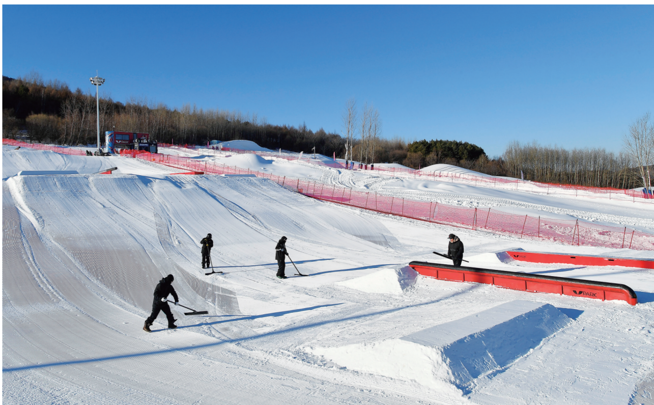
在吉林市万科松花湖度假区V-PARK地形公园,有这么一群人,每到冬季,便会为滑雪爱好者们构建出一块能够尽情玩耍的“滑雪公园”,让更多人体验“飞冰跃雪”的快乐。图为V-PARK地形公园团队成员在平整雪道。

气温走低,消费升温。滑雪培训火爆、滑雪服走俏、滑雪度假区星级酒店预定火热……入冬以来,“冰雪热”成为我省消费复苏的有力依托。