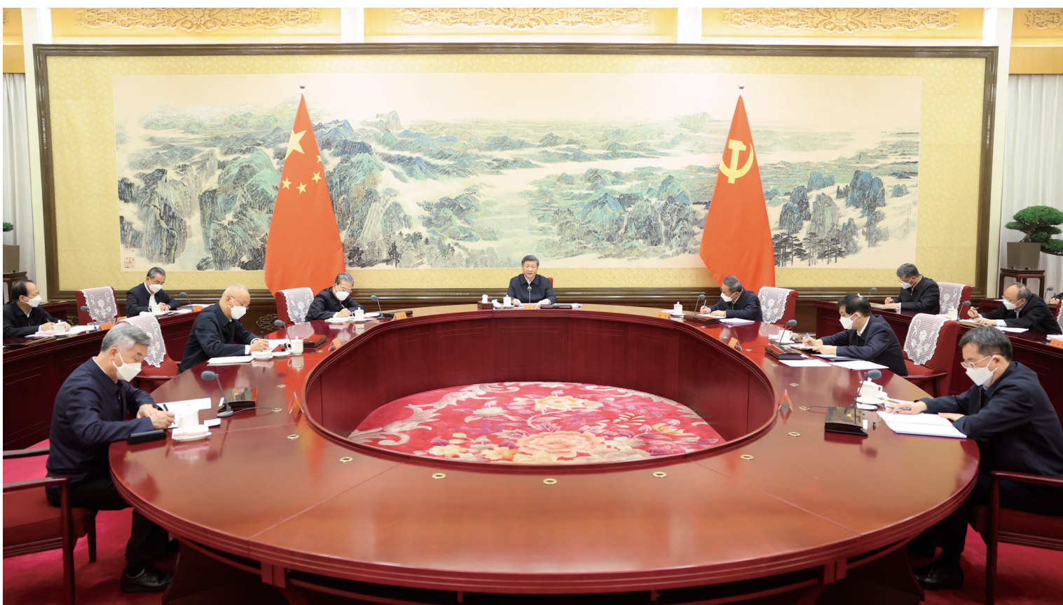
12月26日至27日,中共中央政治局召开民主生活会,中共中央总书记习近平主持会议并发表重要讲话。