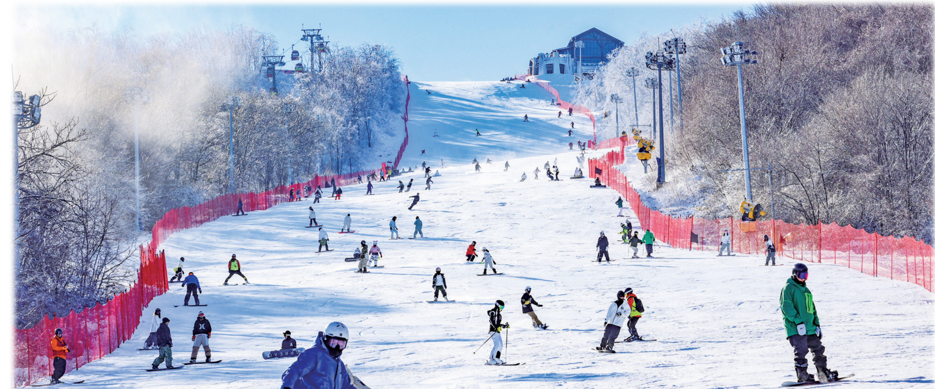
吉林市冰雪经济快速发展迅猛。

发挥产业项目支撑作用,促进项目建设提速提质、达产达效。全力推动吉林化纤15万吨原丝一期、中泽吉铁钼深加工一期碳纤维生产线等项目投产,完成永吉冰雪装备产业园项目一期工程、与一汽解放汽车有限公司签署