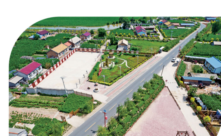
吉林市七边环境治理效果显著。