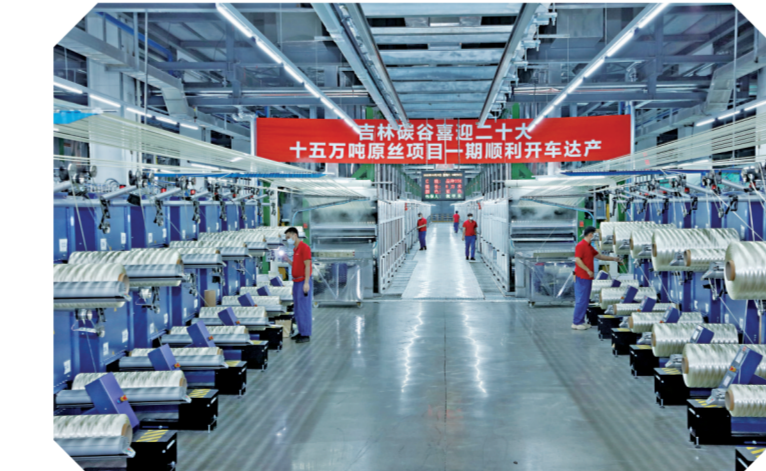
吉林化纤集团十五万吨原丝项目一期开车成功。

预计到年底,吉林市新认定高新技术企业将达60家,新增国家科技型中小企业55户,科技型中小企业达190户,省级以上大学科技园3个;省级以上科技企业孵化器达9家,省级以上众创空间达8家;共99户企业319个项目获得省级以上资金支持6358.9万元。