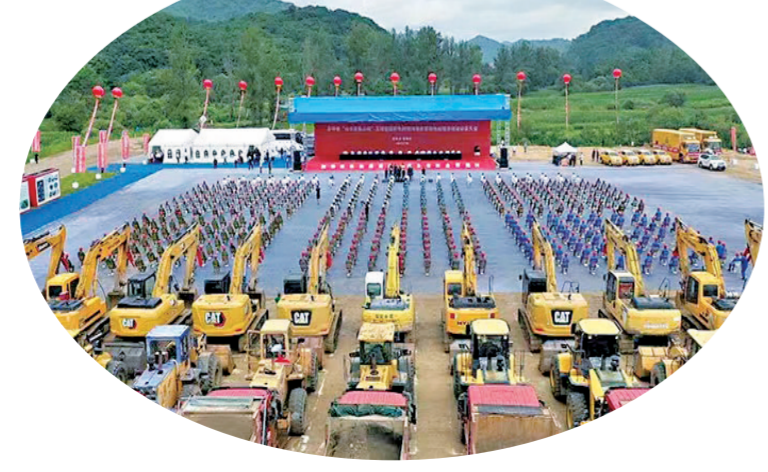
国网新源吉林蛟河抽水蓄能电站筹建期工程开工现场。

匠心细作,精准促倍增。吉林市把“工匠精神”运用到招商引资工作中,围绕16条产业链精心谋划了143个重大项目。全力引进延链、强链项目,充