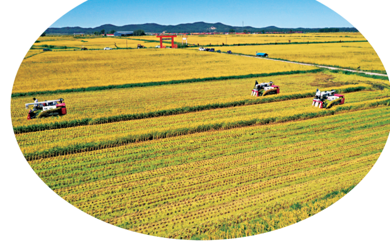
吉林省秋季水稻大丰收。