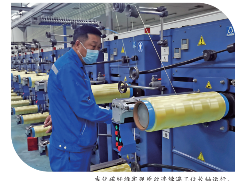
吉林碳纤维实现原丝连续满工位长轴运行。

现代化生产线连续投产,产业园区建设日新月异,专精特新企业蓬勃发展……在今年极为特殊的宏观形势下,吉林市千方百计稳定工业运行,规模以上产值同比增长。发展稳健的工业经济,成为吉林市实现“止跌、回升、增