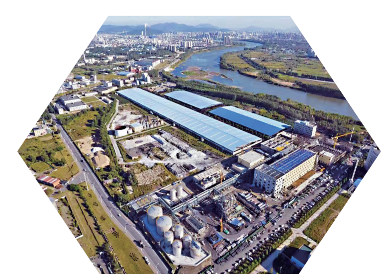
吉林化工园区绿色低碳循环经济资源综合利用项目。

筹推进水资源、水环境、水生态治理,加强土壤污染防治防控。今年1月至11月,吉林市空气质量优良天数294天,优良天数比例88%,预计全年各项环境空气指标全部达到国家二级标准。1月至11月,19个国家考核断面优良水体比例94.7%、达标率100%,预计全年优良水体比例能够达到考核要求。