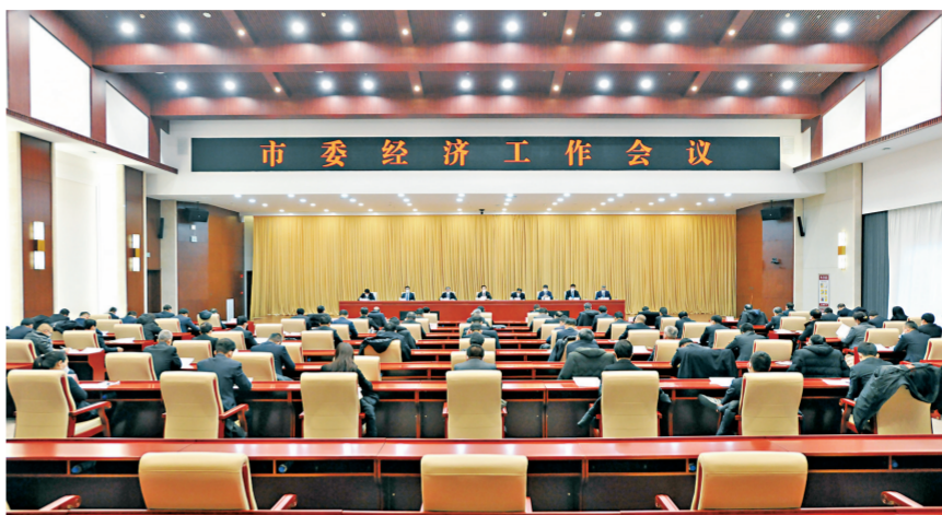
2022年12月27日,通化市委经济工作会议在吉林杨靖宇干部学院召开。

岁末回眸,通化经济大船顶住压力、破浪前行,一幕幕场景令人难忘。2022年,通化只争朝夕。全年计划实施的220个5000万元以上项目上半年全部复工,投资完成率超过100%;坚持“线上”招商、“云上”签约,全年招商引资引进项目126个,到位资金303.2亿元,增长22.8%。