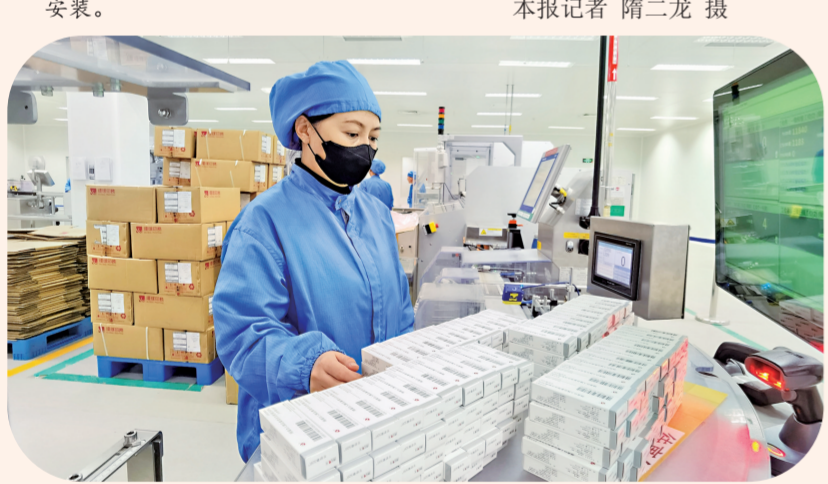
通化东宝重组人胰岛素注射液三车间。