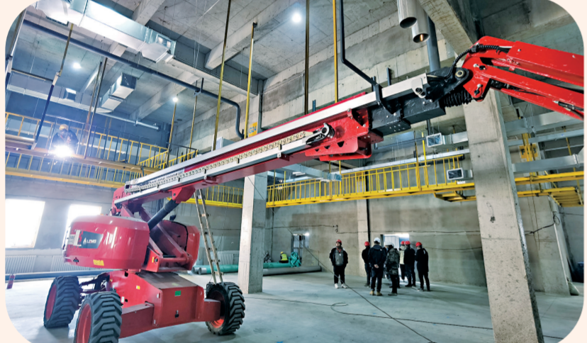
通化安睿特生物制药一重组人白蛋白生产基地项目正在进行机电安装。本报记者 隋二龙 摄