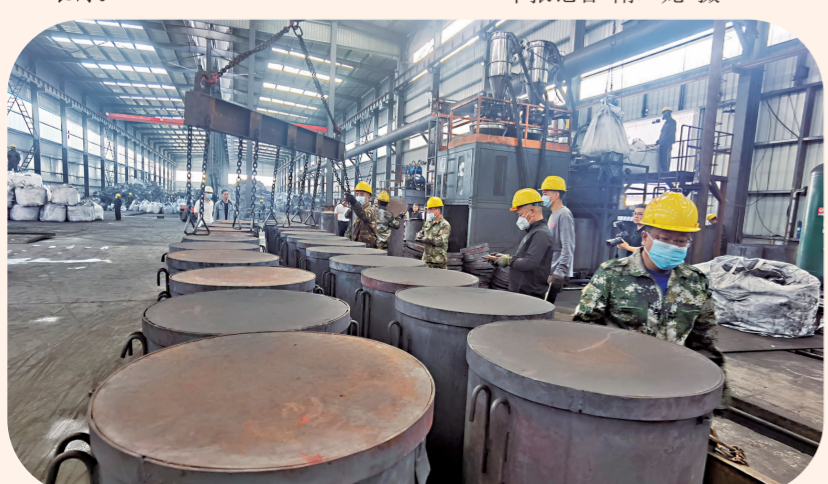
中溢集团(吉林)新能源科技有限公司生产车间一角。