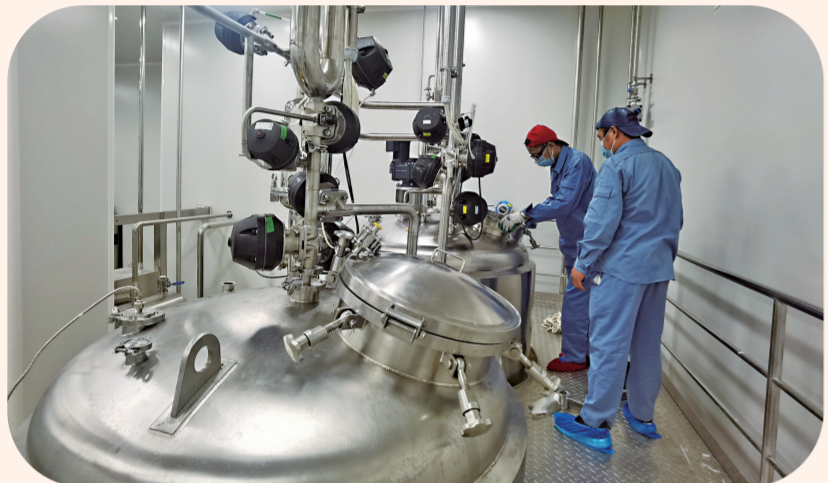
通化东宝生物医药产业园内,工人正在安装设备。

贯彻党的二十大精神,落实中央经济工作会议部署,忠实践行习近平总书记视察吉林重要讲话重要指示精神,坚持稳中求进工作总基调,完整、准确、全面贯彻新发展理念,服务和融入新发展格局,更好统筹疫情防控和经济社会发展,更好统筹发展和安全,有效防范化解重大风险,深入实施“一主六双”高质量发展战略,按照“一个中心、四个跨入、五个突破”发展定位,着力实施贯彻党的二十大精神、推进通化绿色转型全面振兴“二十大行动”,坚持用“五化”闭环工作法抓落实,突出做好稳增长、稳就业、稳物价工作,实现质的有效提升和量的合理增长,在中国式现代化进程中奋力推进通化绿色转型、全面振兴。