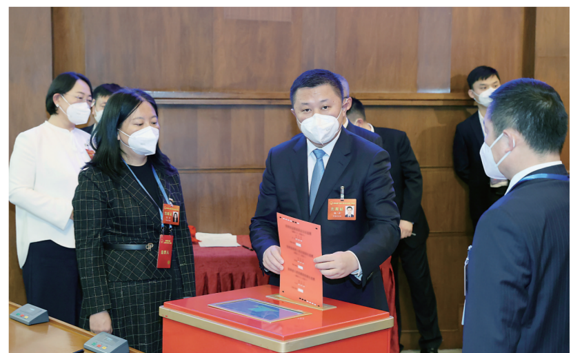
▼人大代表投下庄严的一票。