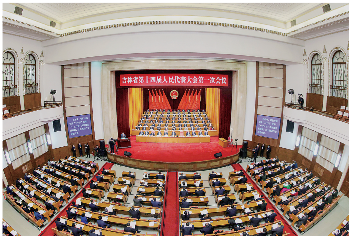
▼省十四届人大一次会议在长春举行。图为大会会场。