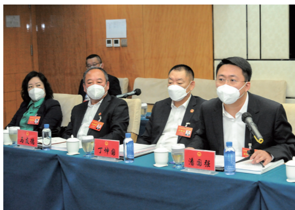
▼在分组审议中,代表们建言献策、履职尽责。