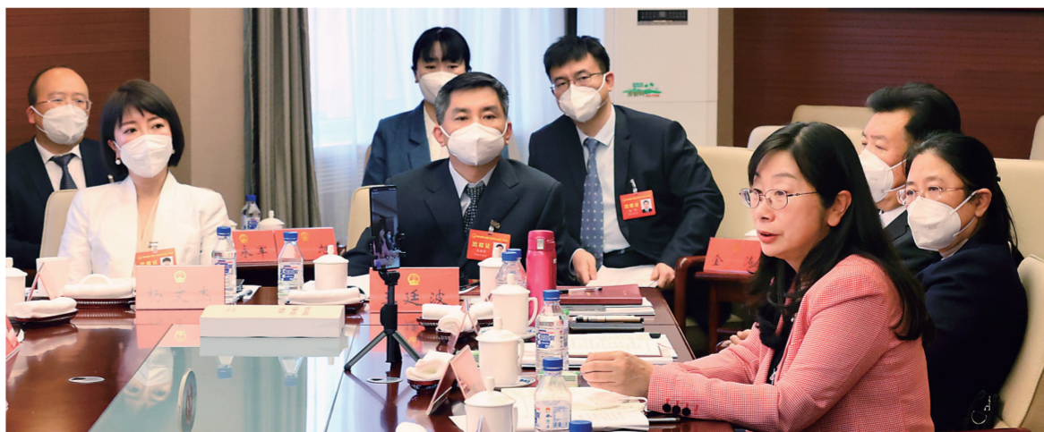
▲出席省十四届人大一次会议的代表分组审议政府工作报告。