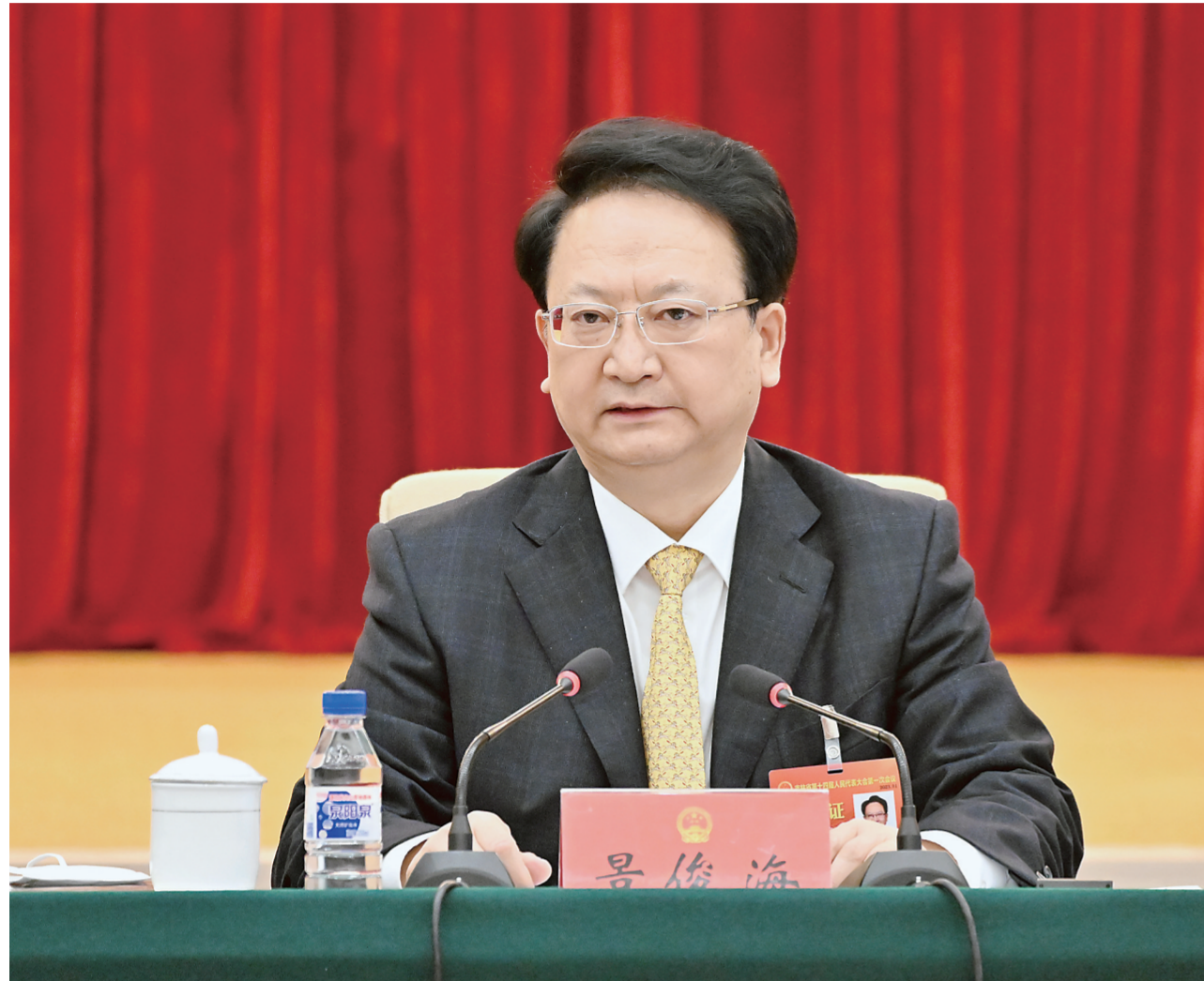
▲景俊海代表在省十四届人大一次会议分组审议时发言。