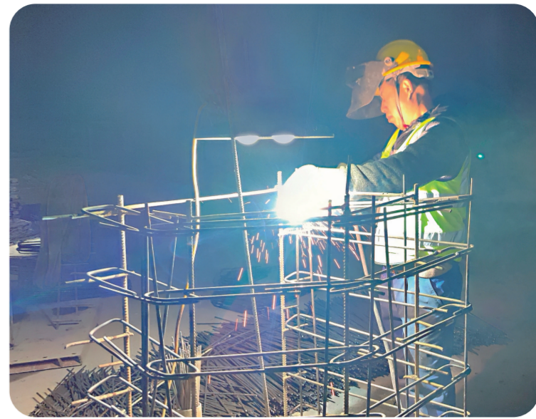
桓集高速02工区五道岭隧道施工现场。

强化服务理念,大力弘扬优秀企业家精神,2018年以来连续举办四届“企业家节”,评选出5位功勋企业家、20名杰出企业家、10名优秀新生代企业家、16名优秀域外企业家和20名“通化经济年度人物”,极大激发了企业家干事创业热情。建立“英才卡”“法人卡”制度,向受表彰企业家颁发“英才卡”,向全市规模以上企业负责人颁发“法人卡”,持卡者可在子女教育、医疗等方面享受便利化服务。2022年,全市民营经济市场主体数量16.04万户,占市场主体总数的99.4%,同比增长3.1%;全市民营企业2.88万户,占企业总数的95.9%,同比增长4.75%;民营企业上缴税金25.5亿元、占税收收入的72%;民营经济贡献了80%以上的城镇就业。2022年8月,通化市获批全国新时代“两个健康”先行区创建经验推广试点城市,是东北地区唯一入选城市。