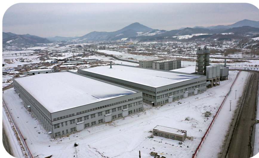
鑫鸿环保新材料产业基地项目。

截至目前,项目一期完成投资4.5亿元。1号厂房正在进行高低压设备安装和窑炉DCS控制系统安装,高压设备已经完成70%,1#纳米活性钙生产线网带烘干机正在制作中;2号厂房正在进行配套电气设备安装;原料库厂房已建设完成,正在进行输送设备安装;窑炉、成品罐正在进行设备保温及窑炉烘炉工作;综合楼、办公楼正在进行内部空调和电气安装;外部道路管网已完成。