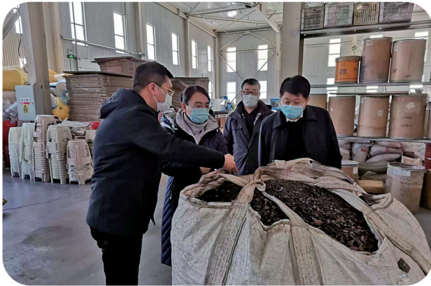
通化市工信局工作人员入企服务解难题、促发展。

强化政策落实,打造更加精准的政策环境,通化市、县两级建立党政领导干部联系服务重点民营企业制度,实施包保重点项目责任制。持续开展“暖企行动”,实施工业“双50”、商贸“双50”扶持计划,出台《关于促进民营经济加快发展的若干措