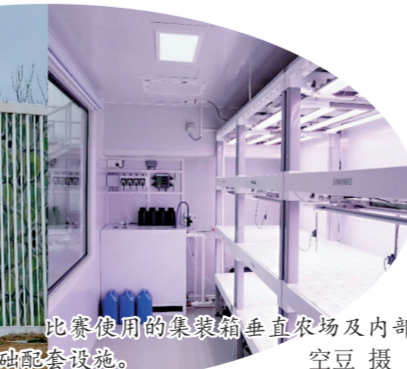
比赛使用的集装箱垂直农场及内部基础设施。

“未来,设施农业应是跨学科、跨领域的综合体,需要大量传感器和大数据算法作为支撑,改变目前农业以经验种植为主的现状。”“生菜快