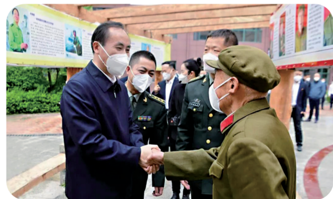
省退役军人事务厅调研组在吉林市调研时看望慰问参加革命战争的老兵。

2022年以来,省退役军人事务厅开展“最美退役军人”“最美军嫂”“最美兵支书”选树活动,推选刘亮当选全国“最美退役军人”。在媒体开设“吉林退役军人”专栏,大力宣传退役军人先进事迹。成立省关爱退役军人文学艺术联合会,开展“寻访老兵足迹”“老兵永远跟党走”“退役军人同唱一首歌”系列活动。积极协调各级党委、政府开展“9·30”烈士纪念日活动、吉林省烈士光荣证颁授仪式。争取中央专项资金,圆满完成县级以上烈士纪念馆设施整修工程。联合党史等部门,积极挖掘研究英烈史料,开展烈士追评工作,总结宣传教化“戴家大院”英烈事迹。开展“强国复兴有我·英烈精神永传”“清明祭英烈”等活动,营造尊崇英烈社会氛围。延边州深入挖掘英烈文化,组织编撰《延边烈士英名录》,在全省率先启动烈士纪念馆“互联网+”模式,实现烈士纪念馆设施常态管理。