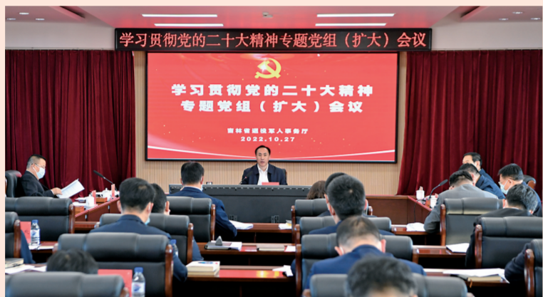
省退役军人事务厅召开党组(扩大)会议,对学习宣传贯彻党的二十大精神进行部署。