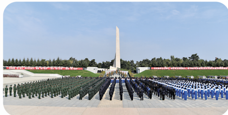
吉林省暨长春市举行向人民英雄敬献花篮仪式。

2022年,省退役军人事务厅组织全系统慰问帮扶一线部队和边远艰苦哨所,走访慰问部队1000余支(次),赠送慰问金(品)8000余万元。组织各地为1685名现役官兵家庭送去立功喜报。组织13个全国双拥模范城参与“情系边防官兵”专项慰问新疆部队活动。指导珲春市与海军某部完成全国“城连共建”试点任务。做好75名随军家属安置工作。持续开展“爱心献功臣”军地医疗队下乡送医送药活动,解决优抚对象医疗难题。通化市坚持国防与经济社会同步建设,协调投入专项资金打造军地共建暖水河谷综合体项目。