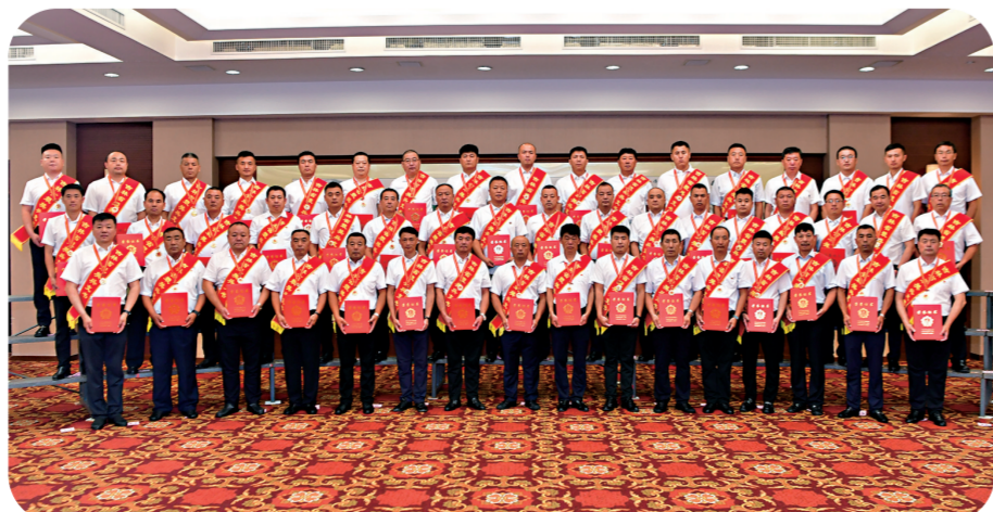
吉林省举行“情系最可爱的人·2022年最美兵支书”发布仪式。