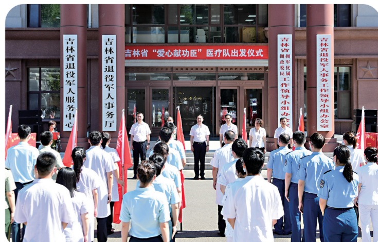
吉林省举行“爱心献功臣”医疗队出发仪式。