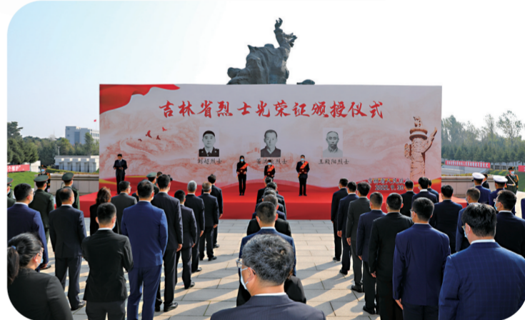
吉林省人民政府在长春市烈士陵园隆重举行烈士光荣证颁授仪式。