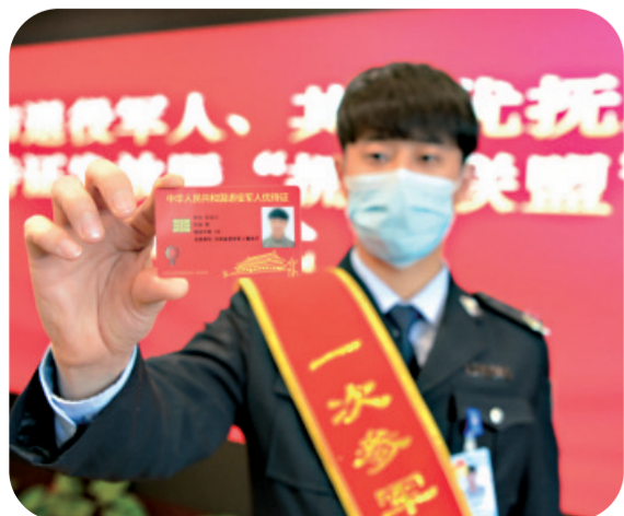
吉林省首批退役军人、其他优抚对象优待证发放仪式在延吉市举行,图为退役军人展示领取到的优待证。