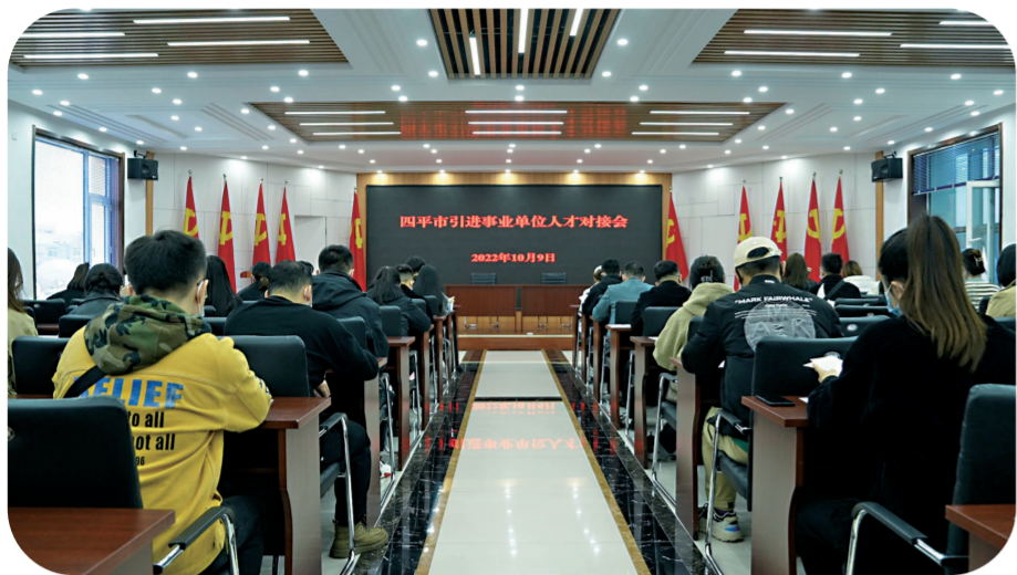
四平市引进事业单位人才对接会。