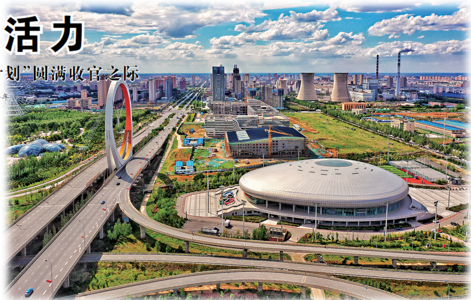
发展中的四平。

提前布局“回引链”，共开展6批次“走进四平”“返家乡”社会实践活动，为1462名大学生提供市直单位及县（市）区基层单位实习岗位3016个。成立社会实践临时团支部，指导实践学生开展“四个一”活动，实现全流程管理和服务。制作引才宣传片，市委书记郭灵计发出“创业有你 圆