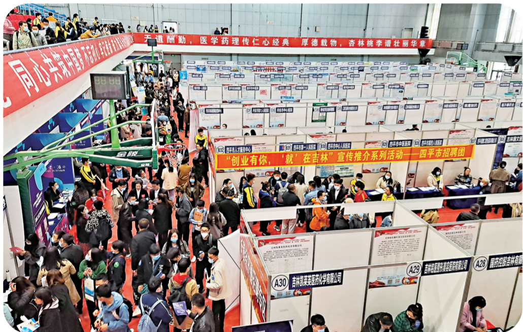
“创业有你 就在吉林”宣传推介活动现场。

为域外来四平的引进人才，免费提供为期3年的人才公寓，在指定房地产企业购房享受人才优惠价格。依托“大学生主题社区”，组织“联谊沙龙”，为人才搭建交流交友、婚恋平台。实施“人才金卡”“英才绿卡”制度，在医疗、交通、住宿、餐饮等方面给予优惠。对子女落户四平的引进人才，给予2000元落户奖励金，已为4批次的122户人才发放子女落户奖励金24.4万元，子