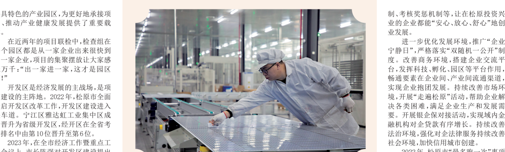
松原市新能源光伏科技有限公司光伏板项目。