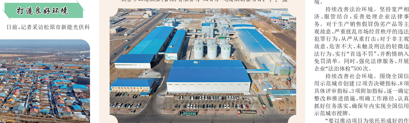
吉林旭鑫油脂有限公司。