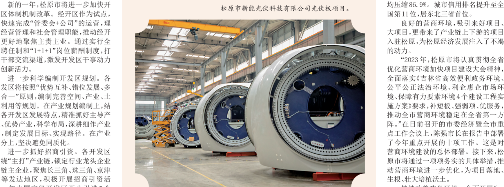
中车松原新能源装备制造产业园项目。