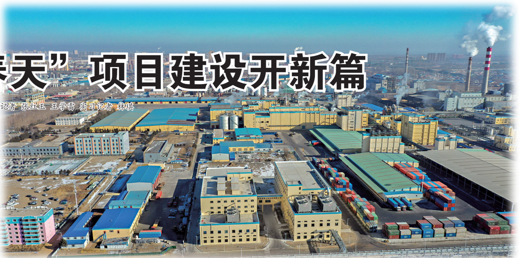
嘉吉生化有限公司。