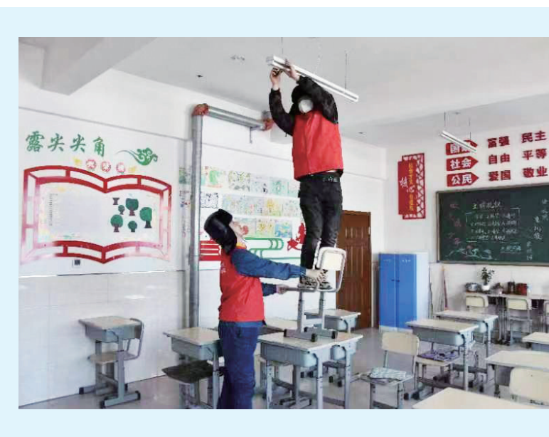
近日，国网农安县供电公司组织员工深入全县中小学，为学校检查用电情况，排除安全隐患，确保开学后用电安全。

如今，绿起来、富起来的清水村正在加强乡风文明建设，房院墙体、村间小路上的“涂鸦”画出了对美好生活的向往。致富兴业、院貌整洁、孝老爱亲、志愿服务……作为德治示范村，清水村每年都会开展星级文明户创建、评选活动，家家争创“十星文明户”，精神面貌焕然一新。