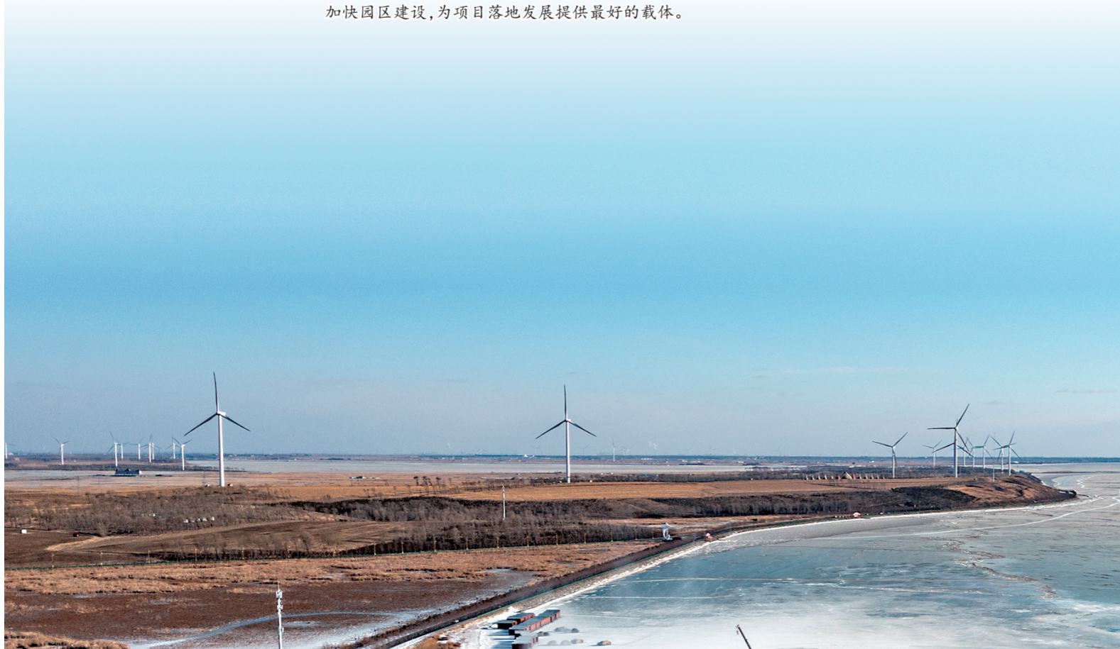
坚持走生态优先、绿色发展之路，持续不断优化营商环境，全力推进新能源产业发展。图为查干湖畔的风力发电机。