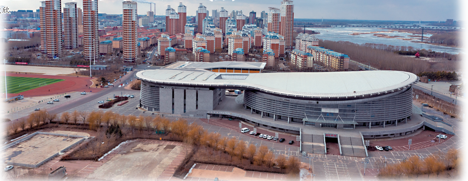
大气现代的城市形象，成为松原靓丽的名片。

“信用金融平台”提供金融保障服务。在全省率先搭建“松原市信用综合金融服务平台”，成立以银行为主体的党委第九支部，不断深化信用平台与银行信贷开展务实合作，为企业搭建以“信”获“贷”桥梁，用金融“活水”灌溉产业“良田”。