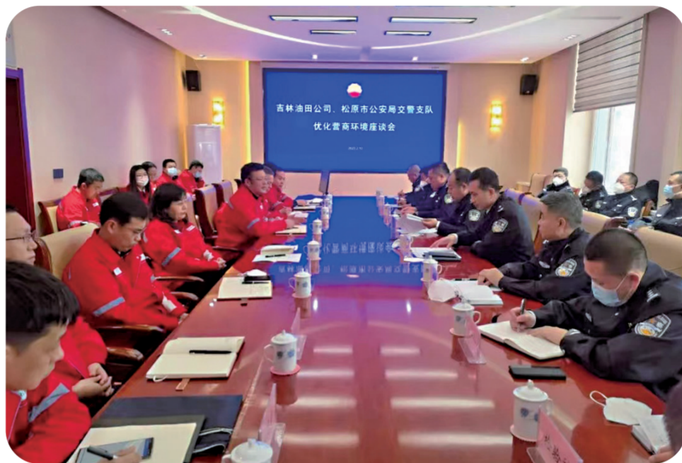
各部门充分发挥职能作用，助力企业发展。图为松原市公安局主动上门为吉林油田纾困解难，提供精准服务。