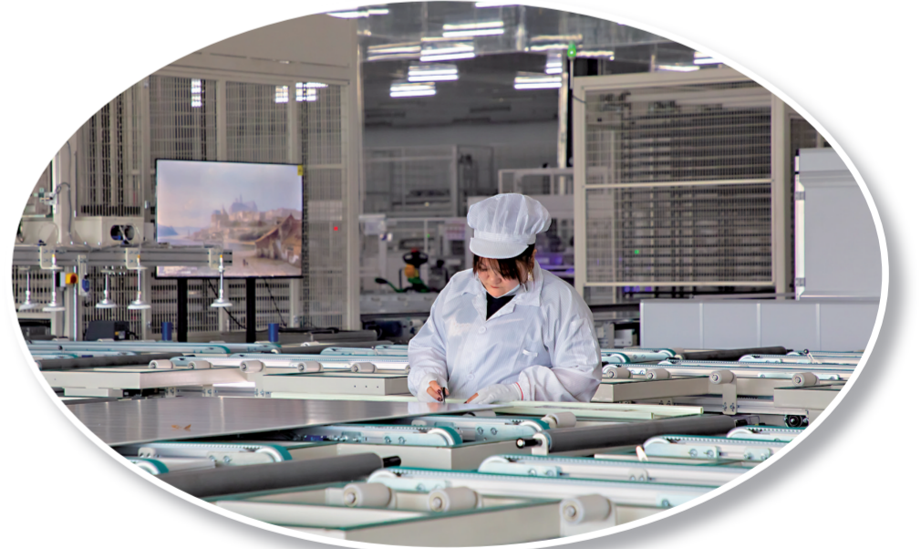
优质的营商环境让企业安心落户生产。图为松原正泰新能源产业园光伏生产项目。

松原市政政局将持续深入打造“六最三化”营商环境，研究制定行动方案，推动松原市营商环境建设水平迈向新台阶；编制《松原市企业全生命周期