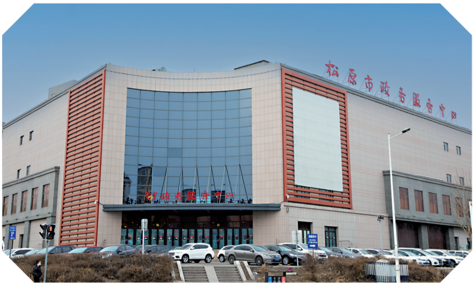
近年来，松原市加快转变政府职能，纵深推进“放管服”改革，行政审批提质增效。图为松原市政务服务中心。