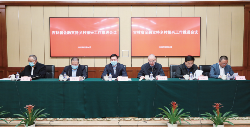
吉林省金融支持乡村振兴工作推进会议现场。

2022年以来，吉林省始终坚持深入贯彻党的二十大精神，紧紧围绕“守底线、抓发展、促振兴”持续增收有力，推动全省脱贫基础不断巩固、成效持续拓展，同乡村振兴有效衔接