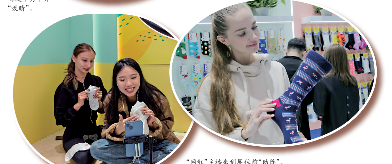
“网红”主播来到展位前“助阵”。