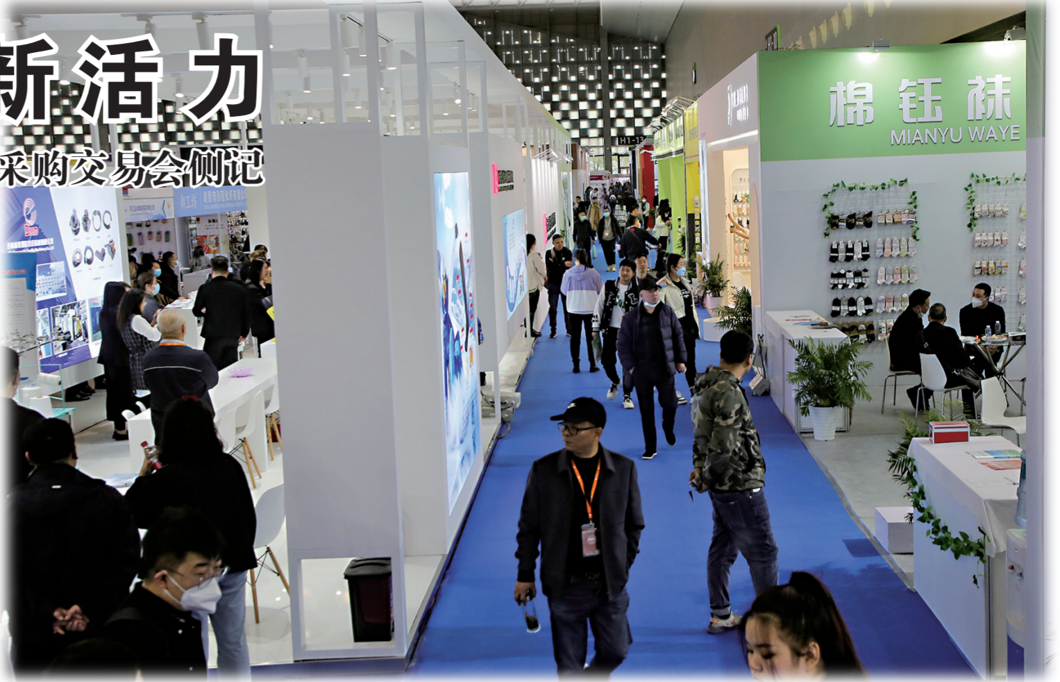
辽源袜子一条街人气十足。

上午9时30分,开幕式刚刚开始,许多采购商便迫不及待地涌进辽源东北袜业园区,抓紧时间看样品、寻合作……跟随熙熙攘攘的人流步入展厅,各地区展出的袜品、内衣、袜机相继映入眼帘。循着琵琶演奏的声音,醒目的展板、大屏幕LED、电子显示屏让人眼前一亮。这便是辽源东北袜业园区展区。透过展板显示屏,宣传片中一个个响亮的头衔引得国内外客商驻足了解。5G数字化织袜实验工厂的“智造力”,全产业链条高度市场化的“核心竞争力”,“双创基地+新业态集聚”激发“创新力”……众多站在行业前沿、独具特色的运营方式令业内人士交口称赞,而那些设计精巧、样式新颖的产品更是让参展客商流连忘返。