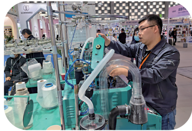
辽源袜机成展会亮点。

袜业园在产品数字化、产业数字化、园区数字化的进程中解锁发展密码。在德盛欧5G数字化织袜实验工厂,智能化的设备可以通过手机端直接接单生产,通过5G、大数据、云计算、物联网等技术,赋能传统袜业,使用行业最先进的数字化自动缝翻一体机、自动下板定型等智能化生产设备,匹配多套自动化运输设备,实现订单、设计、生产、发货的全流程数字化管理,为辽源袜业探索出一条数字化、品牌化的高质量发展之路。成立“辽源纺织袜业工业设计研究院”,持续推进产业创新,通过“两张网”建设,即“生产服务一张网”——工业设计研究院;“生活服务一张网”——织信网,实现园区数字化。截至目前,东北袜业园拥有自主品牌636个,知识产权725项,是国家袜子标准制定和检测基地。新型功能性材料和新工艺不断开发投产,自发热滑雪袜、多孔尼龙袜等新型袜品,获得了国内外市场的广泛认可。百舸争流,奋楫者先。下一步,辽源袜业还将不断强化“核心”,拓展“朋友圈”,在国内外“舞台”上大放异彩。