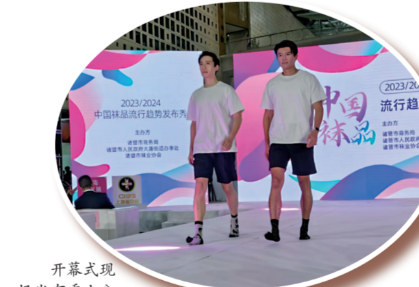
开幕式现场发布秀十分“吸睛”。