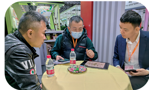
参展企业与客商交流。