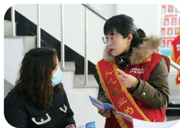
国网抚松县供电公司组织共产党员服务队,走进广场、企业、社区开展电力宣传服务活动。他们向群众介绍节约用电知识,详细解答办电、用电疑问,发放电费电价知识、电能替代等内容的宣传小册子和节约用电宣传单,受到群众好评。

党员示范,打造精品工程。公司发挥党建引领作用,始终坚持做到“电网建设到哪里,党组织就延伸到哪里,党员先锋模范作用就发挥到哪里”。为推动电网建设工程达到优质精品工程标准,党支部设立“党员示范岗”“党员责任区”,每名党员亮明身份,明确工作责任,自觉接受群众的监督,喊出了“党员带头不违章、党员身边无违章”的承诺。工程建设过