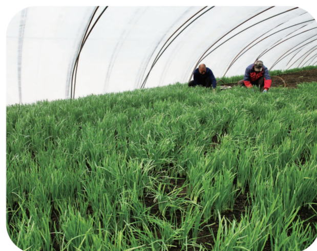
为了让群众增收致富,湾沟镇立足资源禀赋,积极调整种植结构,培育富民产业,把韭菜种植作为引领农户走乡村振兴之路的“金钥匙”,使小小的韭菜焕发出全新的活力。

改善农村人居环境,实施乡村振兴战略的重大任务。江源区立足实际,大力改善城乡环境,稳步提升村容村貌,全力打造宜居宜业美丽家园。全方位推进村庄清洁行动,全覆盖开展人居环境整治,通过美丽乡村、积分超市活动纵深推进干净人家、美丽庭院评比活动,打造“干净人家”1700户。扎实推进农村“厕所革命”,完成农村改厕任务1000户。累计投入近亿元,按照“九有六无”标准和“巩固一批、创建一批、提升一批”总体思路,打造了19个千村示范村,实现“一村一特色、一巷一景观、一户一样板”目标,不断补齐农村基础设施短板。