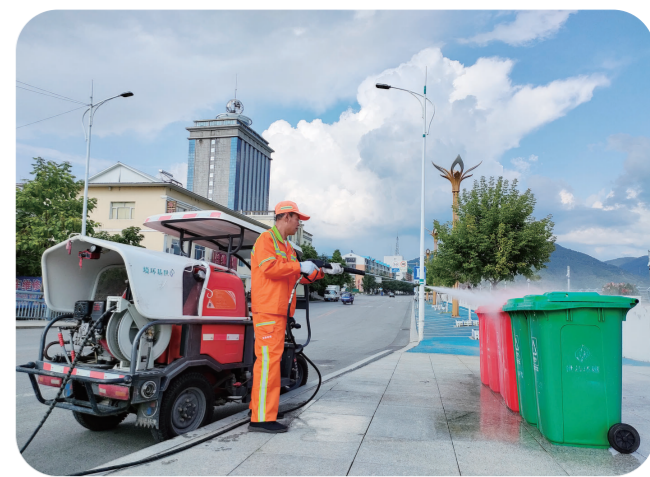
临江市不断加大投入,无害化处理生活垃圾,机扫作业率、垃圾清运率、无害化处理率均达100%,为创建全国文明城市奠定坚实基础。

服务。组织产业项目与金融机构就融资需求、政策信息开展对接,集中向金融机构推介重点企业和重大项目,提升“吉企银通”“银税互动”及“电E贷”“物E贷”“信易贷”功能。鼓励金融机构深入研究各类经营主体的多样化需求,继续加大产品创新力度,设身处地为中小微企业设计产品,以满足各类经营主体的信贷需求。抓牢政策兑现。全面梳理近年来出台的涉及企业项目发展的政策措施,分产业、分行业归纳整理,将土地、税费、财政、金融、人才政策等进一步细化,提取“干货”,用最精简易懂的文字概括,汇编印刷成册,向社会广泛推送,推动解决政策信息“碎片化”问题造成的企业政策知晓度不高、执行效果打折扣问题。抓牢人才服务。全面落实人才政策3.0版,梳理、制定引才用工计划,制定、完善招才引智政策措施,发挥各类人才、用工招聘信息平台功能作用,加快引进和培育高端人才、专业人才和高技能人才,坚持给平台、给空间、给支持,让各类人才能够一展所长、各尽其能。抓牢信用建设。将社会信用体系建设作为重大战略任务和重要民心工程,加强梯队建设,统筹人员力量,制定切实可行的优化提升举措。持续强化“信易贷”平台推广,积极组织经营主体进行实名认证,提升经营主体入驻信息质量,持续扩大授信规模。开展“诚信建设万里行”主题宣传活动,鼓励各行业部门以图片、图表、图解、视频等可视化方式,多角度、全方位进行解读,形成全社会广泛参与、共建社会信用体系的良好格局。抓牢案件查处。以企业和社会满意为标准,加大对损害营商环境案件的查处力度,特别是产业项目中吃拿卡要、承诺打折扣、不履行契约、乱执法、乱收费、不作为、慢作为、假作为、不作为等。严打涉违法犯罪,公平对待各类经营主体,在项目审批、融资服务、土地使用、公共资源交易等方面对各企业一视同仁。