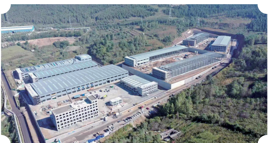
二道江区金属产业园标准化厂房建设项目主体已建设完毕。刘世博 摄

位于桃园五组的二道江区金属产业园标准化厂房建设项目,总投资31483万元,建设包括标准化厂房8栋、综合楼1栋、消防水泵房1座,以及相关配套基础设施。项目负责人