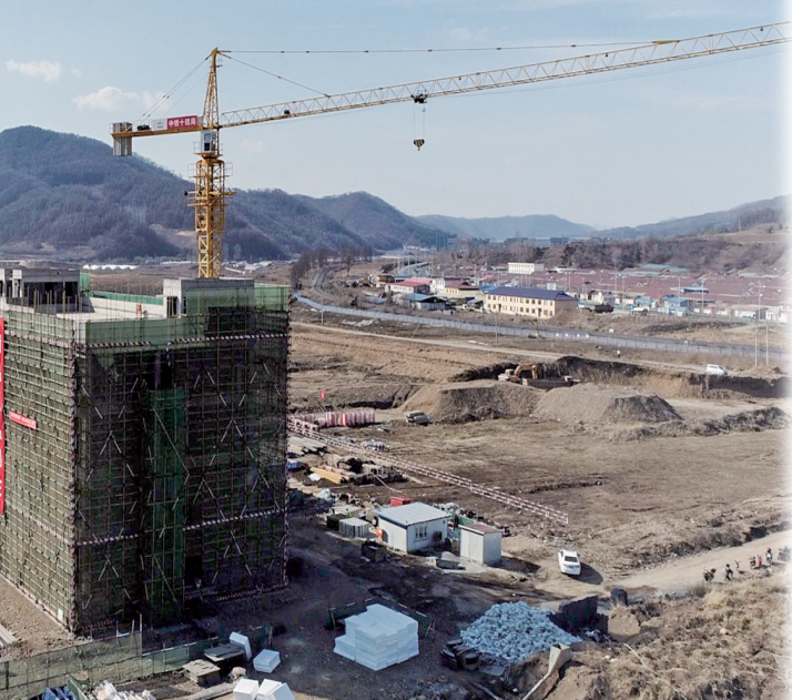
东北亚国际农林产品交易中心项目施工现场。

今年,港务区还将加快完善陆港功能,推进物流枢纽建设,打造开放合作新高地。加强与国内外骨干物流企业、更多港口对接洽谈,完善物流集疏体系,推动资源整合集聚。积极融入“一带一路”建设,抓紧启动通化港智慧物流信息平台建设,深化港务区与长春经开区国际陆港合作发展、企业与高校院所合作,抓住国家发改委设立“吉西南承接产业转移示范区”有利契机,推动医药化工产业的转移和承接。启动“开放合作新高地建设”行动和“开发区高质量发展年”活动,全力推进项目建设,积极谋划大项目、好项目,提升项目保障水平。