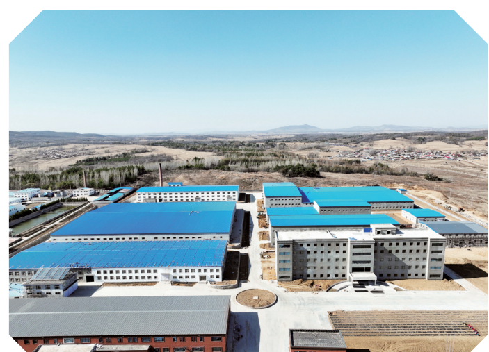
总投资3.8亿元的吉林省俊逸药业建设项目正加紧施工。