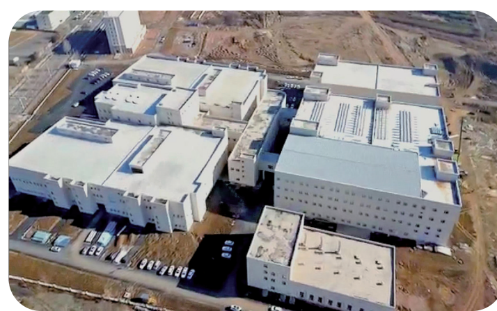
通化安宇特生物制药股份有限公司重组人白蛋白生产基地一期工程建设现场。王殊月 摄

创新推出“项目中心+金融办+银行融资”项目中心+项目秘书+项目专员+项目法人单位”运行模式。项目秘书直接与项目法人单位沟通,全方位了解项目单位需求,项目专员定期调度项目秘书,为项目建