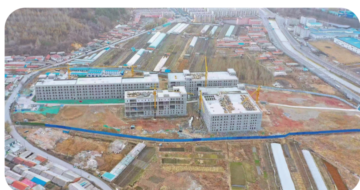
国药集团医药物流通化产业园项目建设现场。

进行。项目负责人宋昊告诉记者,国药集团医药物流通化产业园总建筑面积11.6万平方米,总投资4.2亿元。截至目前,OEM智能制造工厂办公研发中心、制剂车间、提取车间、仓储库主体封顶。