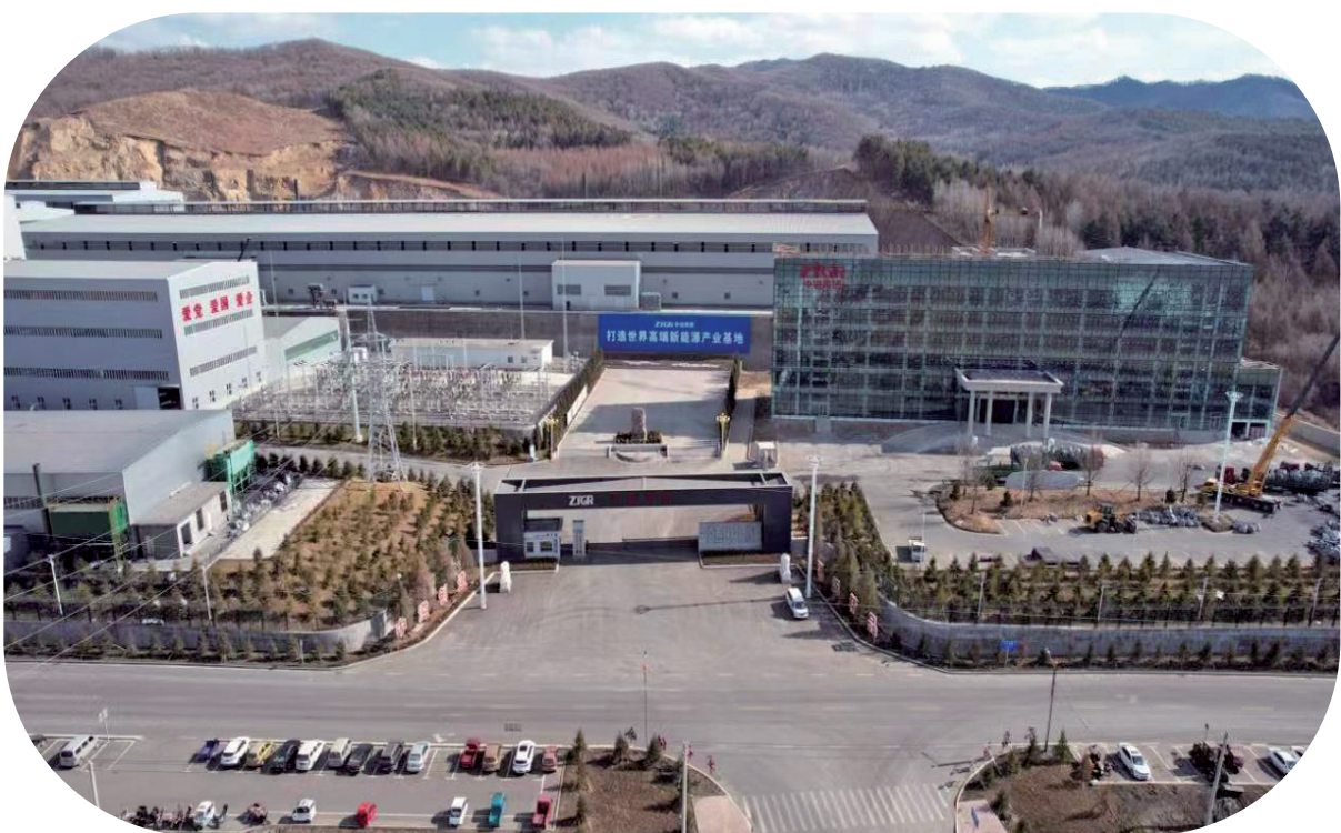
中溢集团年产30万吨新能源负极材料项目已完成投资32亿元。一期项目正在进行厂房、车间主体施工及设备购置安装,预计下半年投产6万吨。

柳河县将项目建设作为经济社会高质量发展的“压舱石”和“推进器”,积极构建科学高效的重大项目工作机制,全力打造营商环境高地、投资洼地、创业福地。