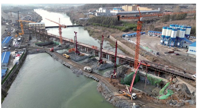
位于通化的沈白高铁吉林林TU-3标项目建设现场。

大浪奔涌逐浪高,蓄势扬帆破浪行。眼下,通化各地正全面加快项目建设,以奋斗者的底色、奔跑者的姿态,加快推进高质量发展。