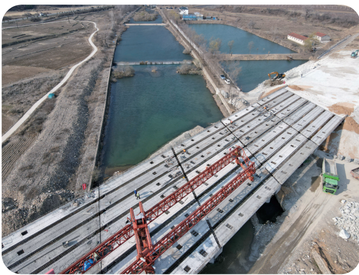
包襄高速公路02工区太平河2号大桥架设完毕。

本报讯(韩林寒 记者李铭)春光无限好,奋进正当时。集安市牢牢把住重点项目集中开工活动契机,坚持稳中求进工作总基调,按照“1234”工作思路,以更加昂扬的斗志、更加务实的作风,开拓奋进,