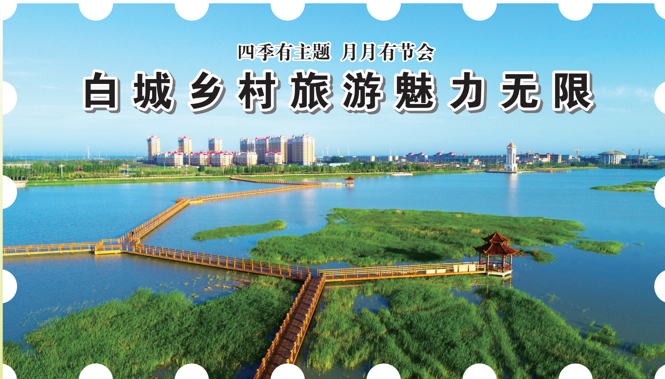
镇赉南湖国家湿地公园。