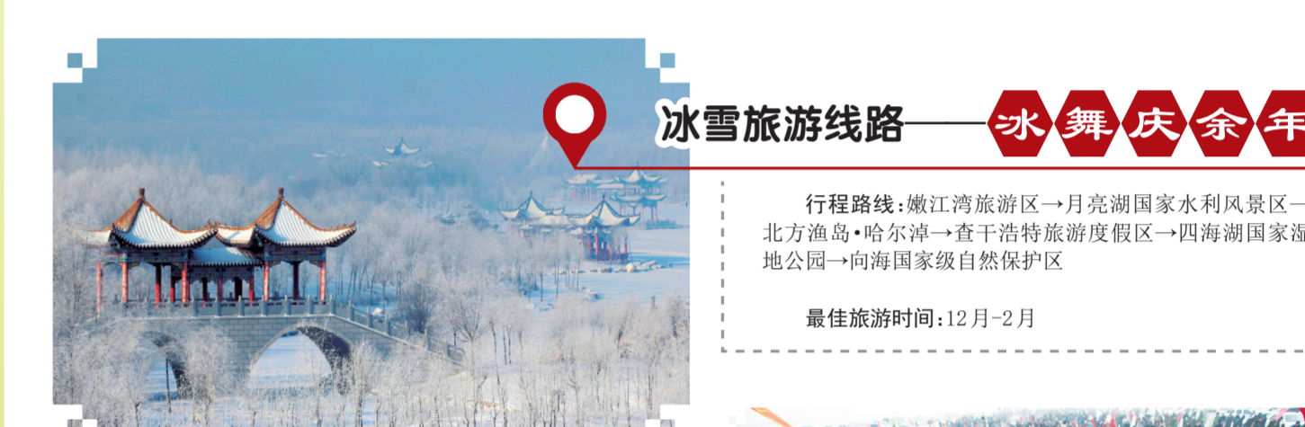
大安嫩江湾旅游区。