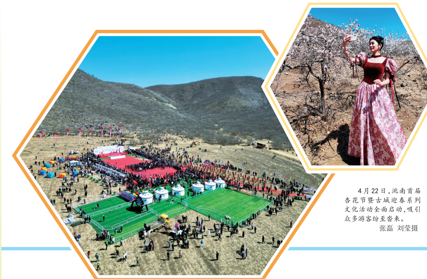
4月22日,泥南首届杏花节暨古城迎春系列活动全面启动,吸引了众多游客纷至沓来。