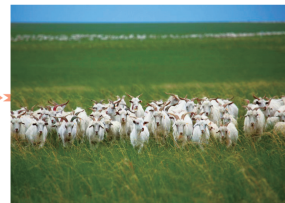
位于镇赉城内的万宝山区草原自然公园。