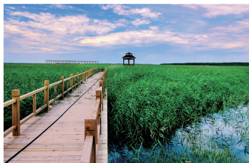
位于大安城内的牛心套保国家水利风景区。