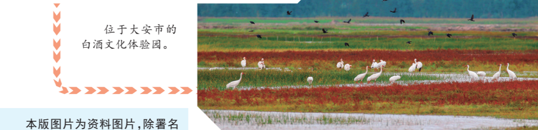
秋日的莫莫格湿地打翻了调色盘。