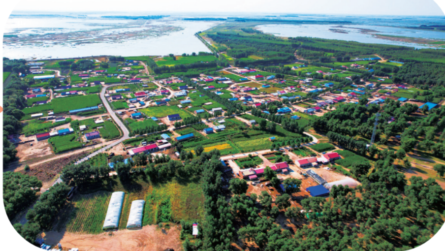
镇赉莫莫格蒙古族乡乌兰昭村。