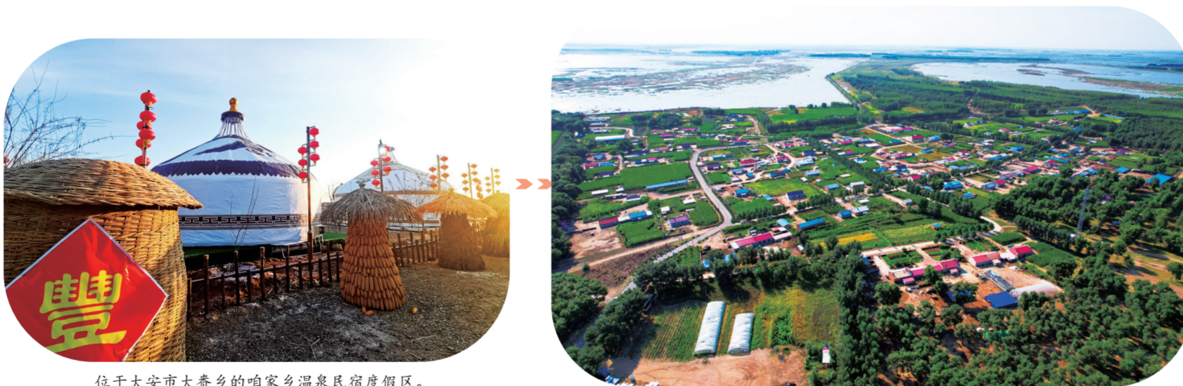
位于大安市大套乡的咱家乡温泉民俗度假区。

苏公七坊、五家子乡村博物馆感受农耕文化,前往通榆德喜神榆、大安百年圣柳去祈福一生顺遂。现场观看大安白酒体验馆中国蒸馏酒发源地的传统技艺——研冰烧酒,聆听乾隆皇帝为向海题词“云飞鹤舞绿野仙踪”的美好传说。 白城乡村旅游的如诗画卷已展开,河湖、草原、湿地、田园、民俗、美食正期待八方来客,白城市文化广播电视和旅游局诚挚向广大游客推介4条精品旅游线路: 以河湖、草原、湿地、森林为依托的生态旅游线路——鹤舞吉祥,以蒙元民俗为依托的民俗旅游线路——漫享蒙韵,以工业旅游、红色旅游、历史文化旅游为依托的研学旅游线路——行阅白城,以冬捕节、冰雪季节庆为依托的冰雪旅游线路——冰舞庆余年。 今年,是白城撤地设市30周年,白城市将以“三十而立再出发”的崭新姿态,不断推动乡村旅游高质量发展,积极构建特色旅游产业集群,努力打造吉林西部旅游名市。