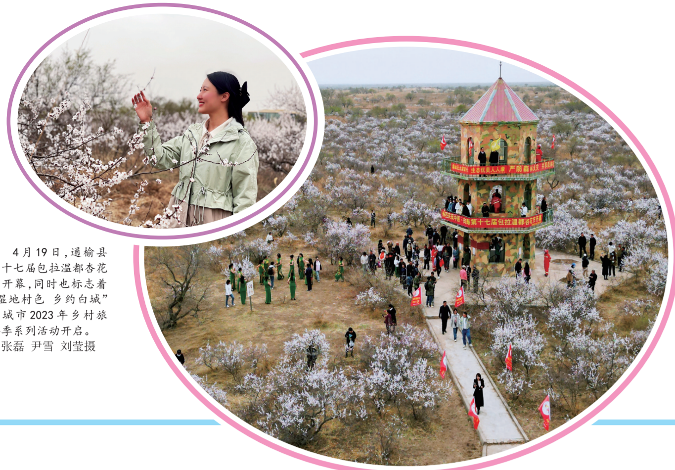
4月19日,通榆县第十七届包拉温都杏花节开幕,同时也标志着“湿地村色 乡约白城”白城市2023年乡村旅游季系列活动启动。