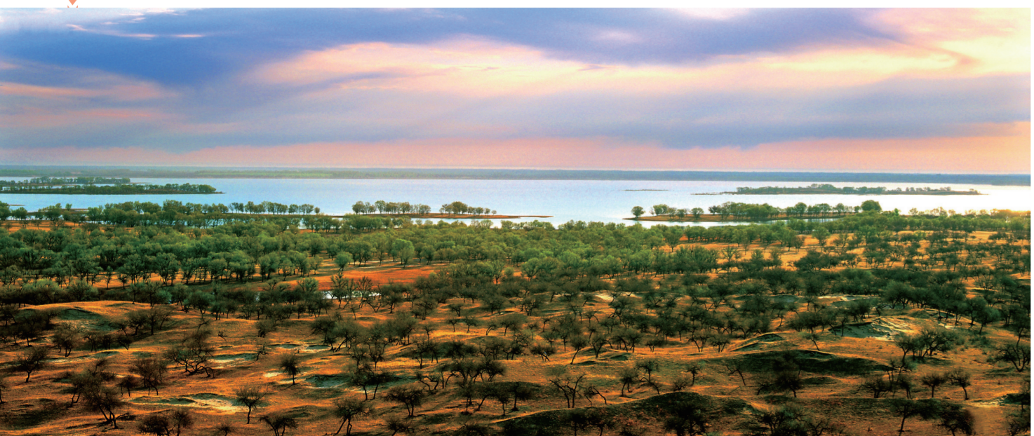
位于通榆的向海国家级自然保护区。