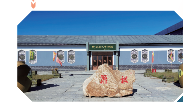
位于大安市的白酒文化体验馆。