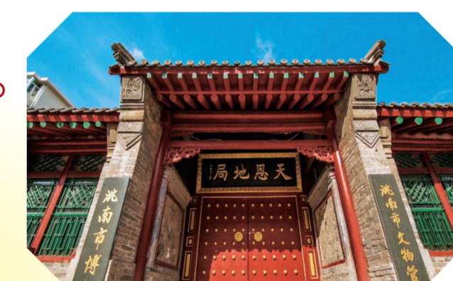
位于泥南市的莫莫格景区。