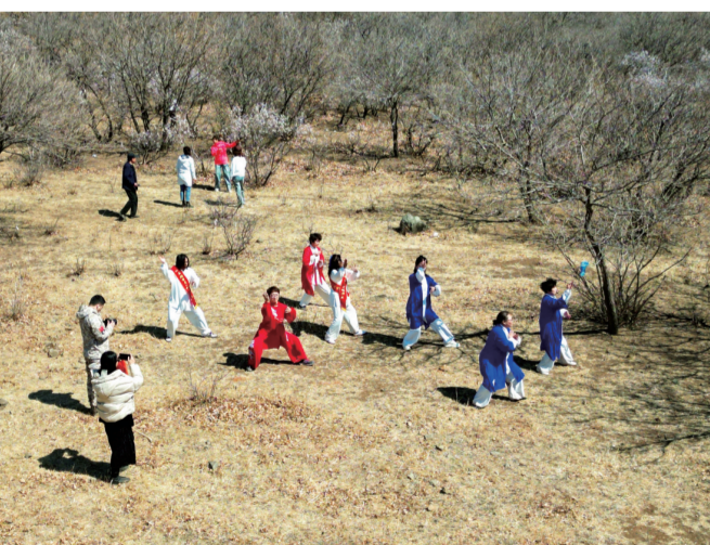
泥南城内的放牛山上春季杏花绽放。