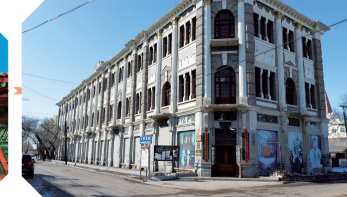
位于泥南市的大帅府。