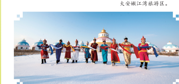
查干浩特旅游度假区。