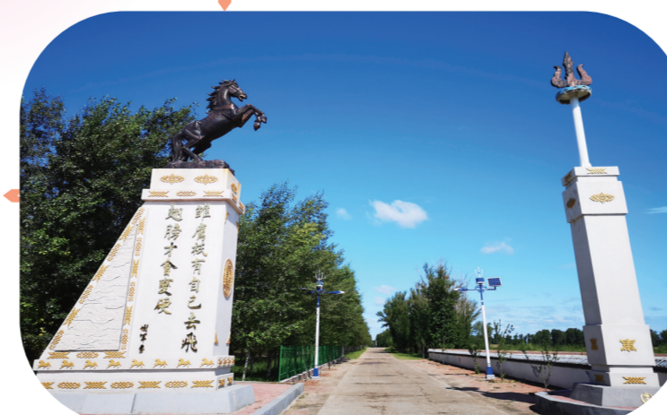
泥北区德顺蒙古族乡乌兰图嘎村。