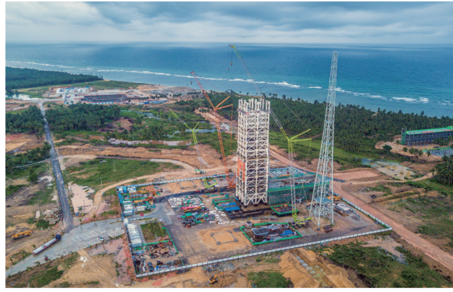
5月12日在海南省文昌市拍摄的建设中的海南商业航天发射场1号工位(无人照相机)。近日,我国首个商业航天发射场海南商业航天发射场1号工位主体结构封顶。

为充分释放“老字号”的创新活力,商务部等五部门于今年初联合印发了《中华老字号示范创建管理办法》。