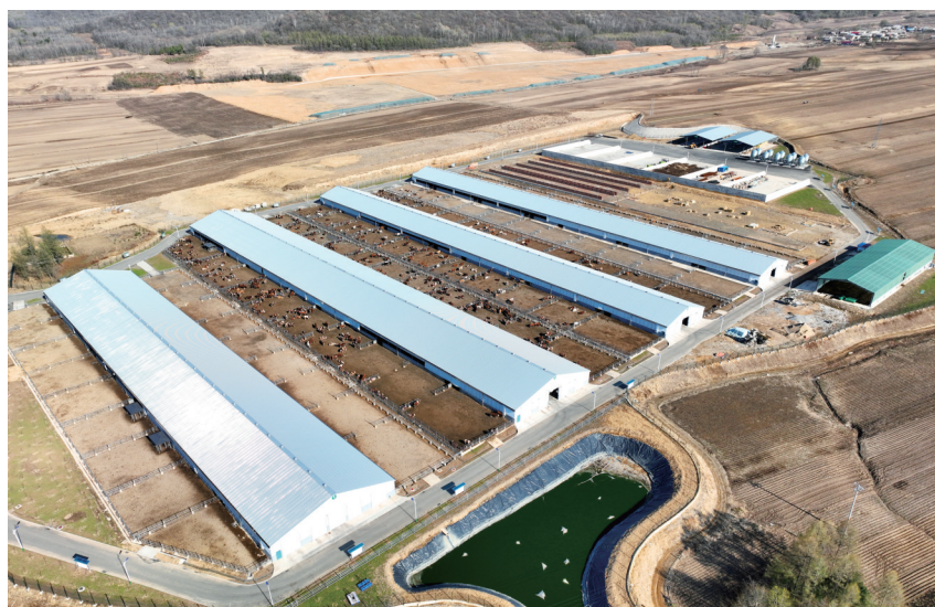
桦甸市坚持扩群增量和提质增效同步推进，农牧循环和地域品牌协同共创，新型联合体和全产业链相互支撑，持续推动肉牛产业高质量发展。图为当地一家肉牛企业的养牛场。