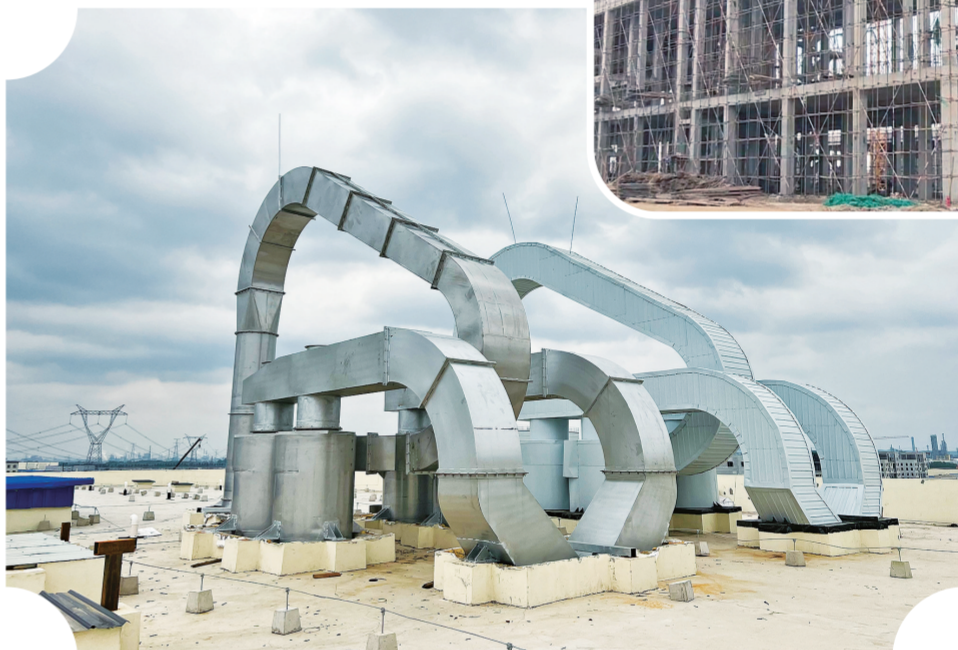
经开区吉林华昊华丰生物科技有限公司年产15万吨工业添加剂系列产品项目一期已经进入收尾阶段。

截至目前,吉林经开区全年拟开复工5000万元以上项目33个,目前已开复工29个,其中,新建项目6个,续建项目23个,开复工率为88%。