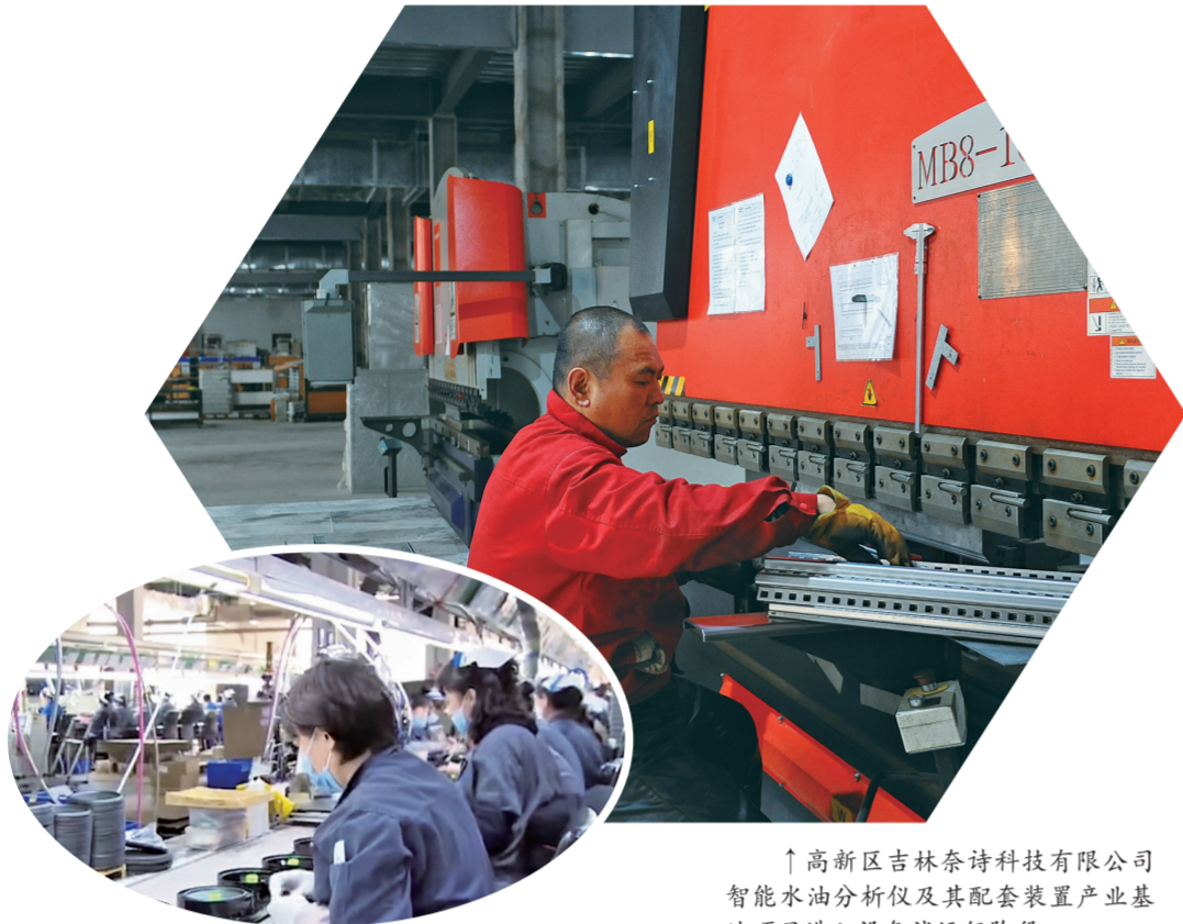
↑高新区吉林奈诗科技有限公司智能水油分析仪及其配套装置产业基地项目进入设备试运行阶段。

高新区吉林航盛电子有限公司年产2000万件车载数字功放音响系统配件项目,已进入试运行阶段。