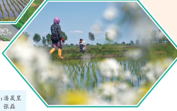
村民在稻田里除草、施肥。