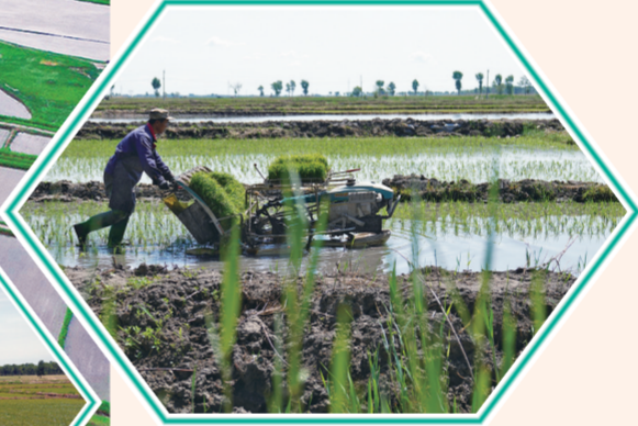
村民在稻田里插秧。