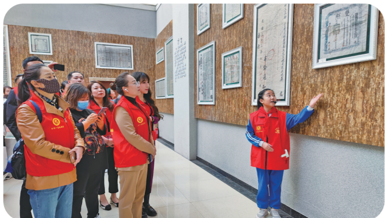
小小志愿宣讲员为前来参观的群众讲解洮南历史文化。张磊 摄

小小志愿宣讲员宣讲活动开展以来,吸引了更多的市民、游客走进洮南档案馆了解洮南的历史,有效激发了市民爱党、爱国、爱家乡的情怀,丰富了广大群众的文化生活。