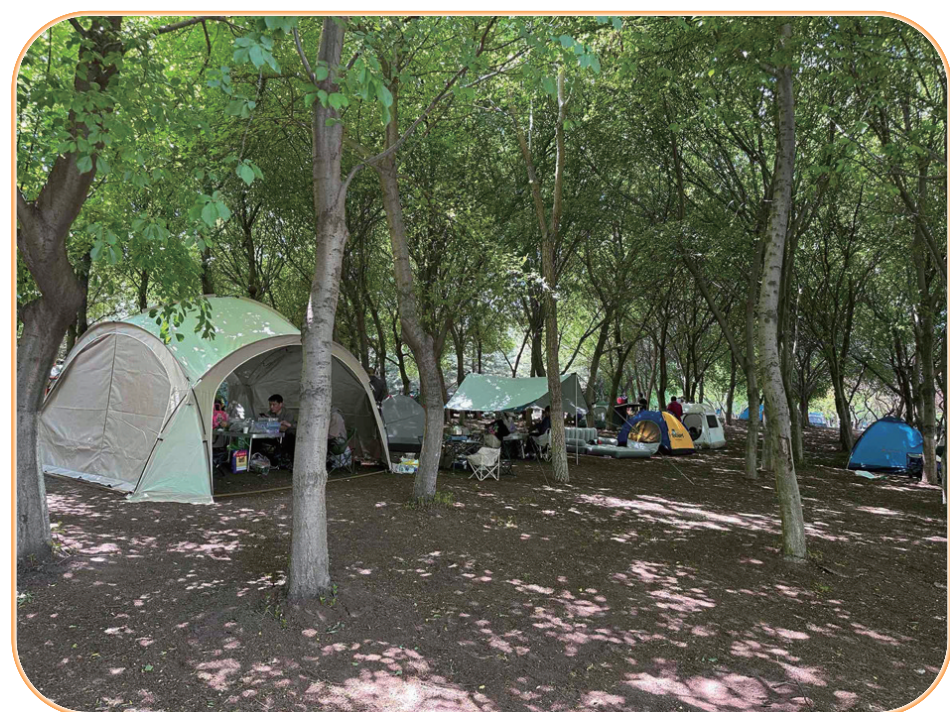
友谊公园内的露营区,大家都能自觉保持良好的卫生环境,做到文明露营。