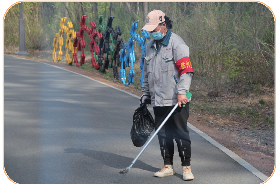
净月潭景区的保洁员人人都是文明宣传员、传播员。在大家的共同努力下,游客文明旅游的意识也在逐步提升。