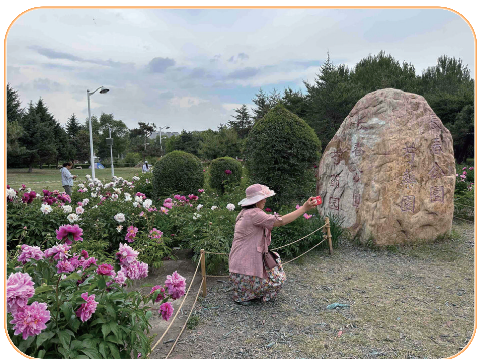
绝大多数游客都能够文明赏花,在隔离线外拍照。