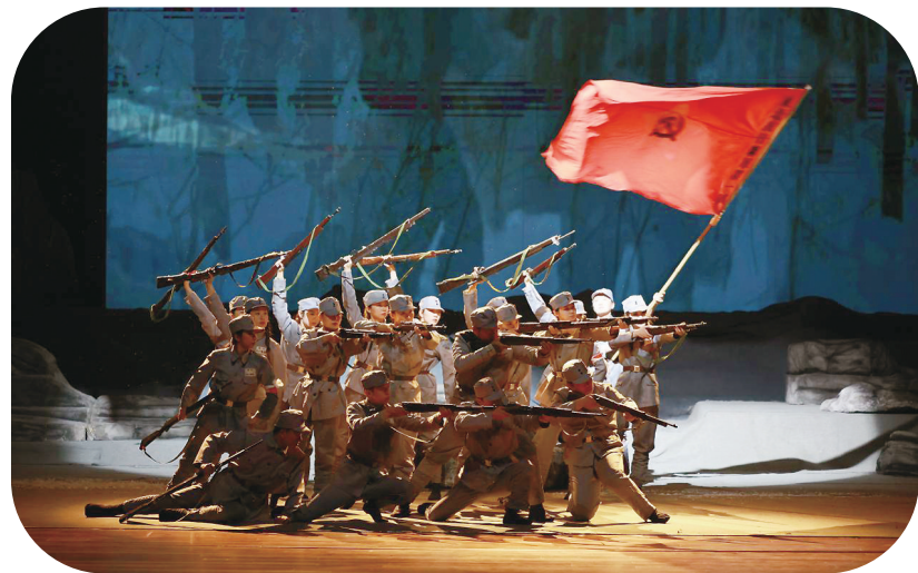
舞台剧《陈翰章》演出场景。

高级将领,威震吉东大地,被誉为“镜泊英雄”。1940年,他率部与日军作战时壮烈牺牲,年仅27岁。