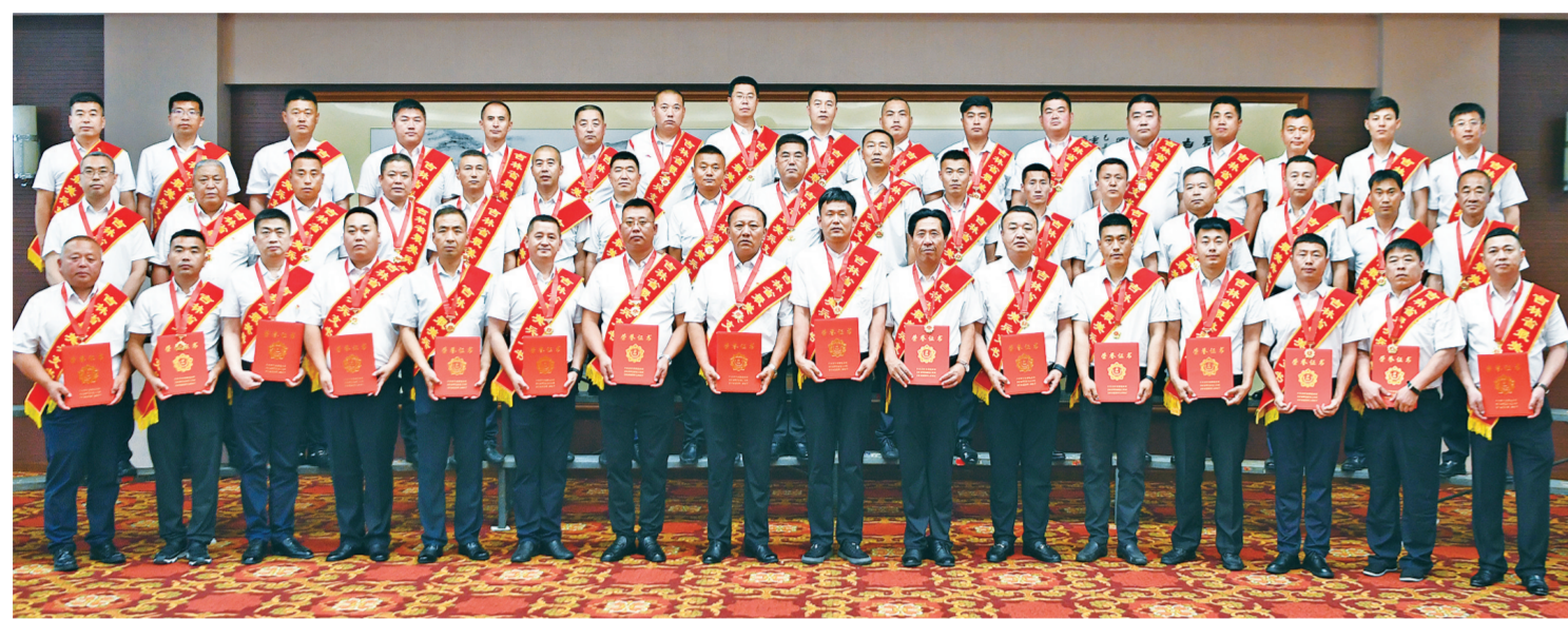
吉林省“情系最可爱的人·2023最美兵支书”当选者合影。李强 摄