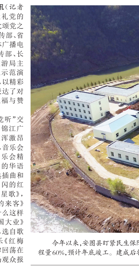
今年以来，安图县拧紧民生保障工程，全力推进县污水处理厂扩建项目建设进度，确保项目按期完工。目前该项目已经完成总体工程量60%，预计年底竣工。建成后将极大缓解中心城区污水直排问题，布尔哈通河榆树川断面上游水质将得到根本改善。

我们要不断深化对党的理论创新的规律性认识，在新时代新征程上取得更为丰硕的理论创新成果。 习近平强调，马克思主义中国化时代化这个重大命题本身就决定，我们决不能抛弃马克思主义这个魂脉，决不能抛弃中华优秀传统文化这个根脉。坚守好这个魂和根，是理论创新的基础和前提。理论创新必须讲新话，但不能丢了老祖宗，数典忘祖就等于割断了魂脉和根脉，最终会犯失去魂脉和根脉的颠覆性错误。我们必须坚持马克思主义这个立党立国、兴党兴国之本不动摇，坚持植根本国、本民族历史文化沃土发展马克思主义不停步，坚定历史自信、文化自信，坚持古为今用、推陈出新，以马克思主义为指导对中华五千多年文明宝库进行全面挖掘，用马克思主义激活中华优秀传统文化中富有生命力的优秀因子并赋予新的时代内涵，将中华民族的伟大精神和丰富智慧更深层次地注入马克思主义，有效把马克思主义思想精髓同中华优秀传统文化精华贯通起来，聚变为新的理论优势，不断攀登新的思想高峰。我们要拓宽理论视野，以海纳百川的开放胸襟学习和借鉴人类社会一切优秀文明成果，在“人类知识的总和”中汲取优秀传统文化资源来创新和发展党的理论，形成兼容并蓄、博采众长的理论大格局大气象。 习近平指出，要及时科学解答时代新课题。时代是思想之母，实践是理论之源。一切划时代的理论，都是满足时代需要的产物。