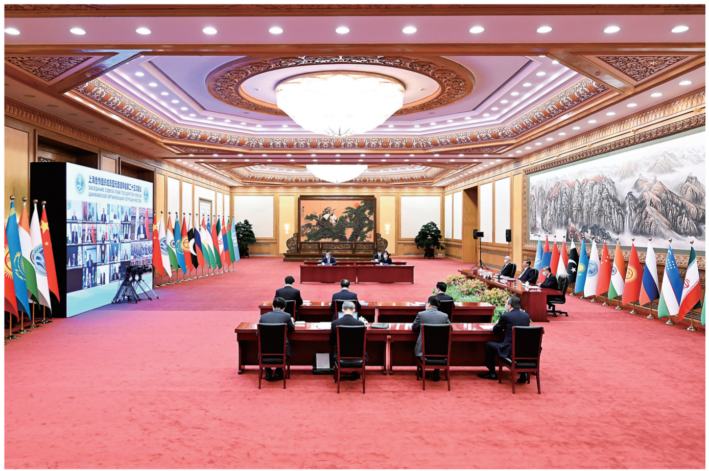
7月4日下午,国家主席习近平在北京以视频方式出席上海合作组织成员国元首理事会第二十三次会议并发表题为《牢记初心使命 坚持团结协作 实现更大发展》的重要讲话。