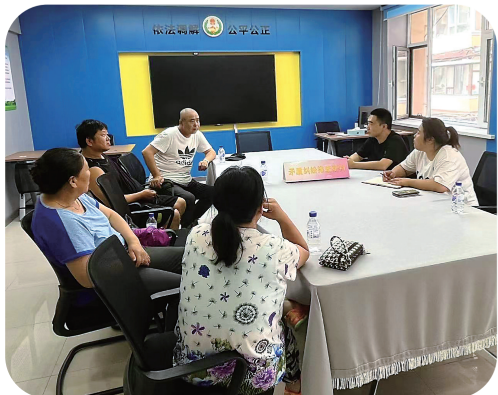
英俊社区党员与居民一起为美好家园建设建言献策。