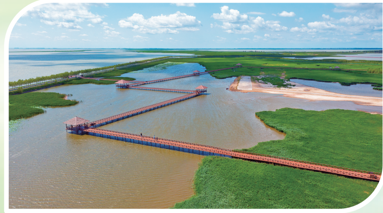
凉亭栈道，感受湖中美景。