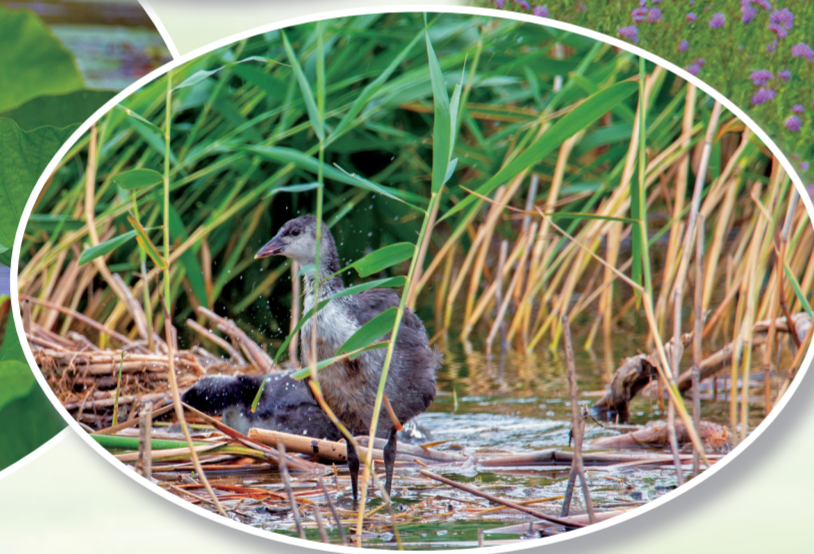
水鸟在查干湖栖息。