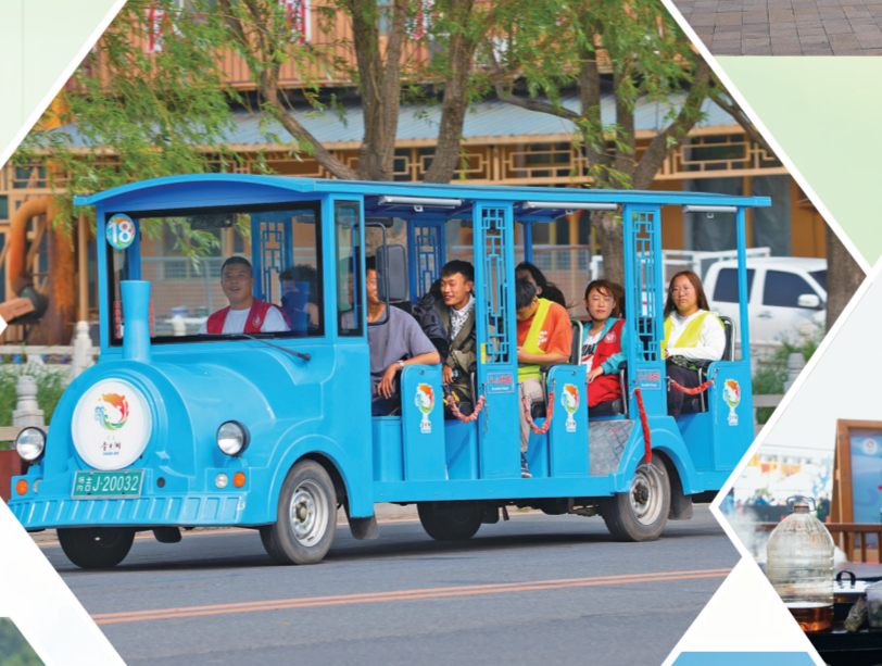
游客乘坐观光车游览景区。