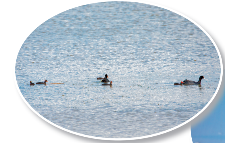
←各是水鸟在查干湖景区内栖息繁育。 ↓水鸟在查干湖景区上空翱翔。