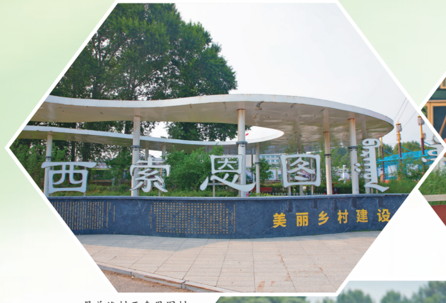
最美渔村西索恩图村。