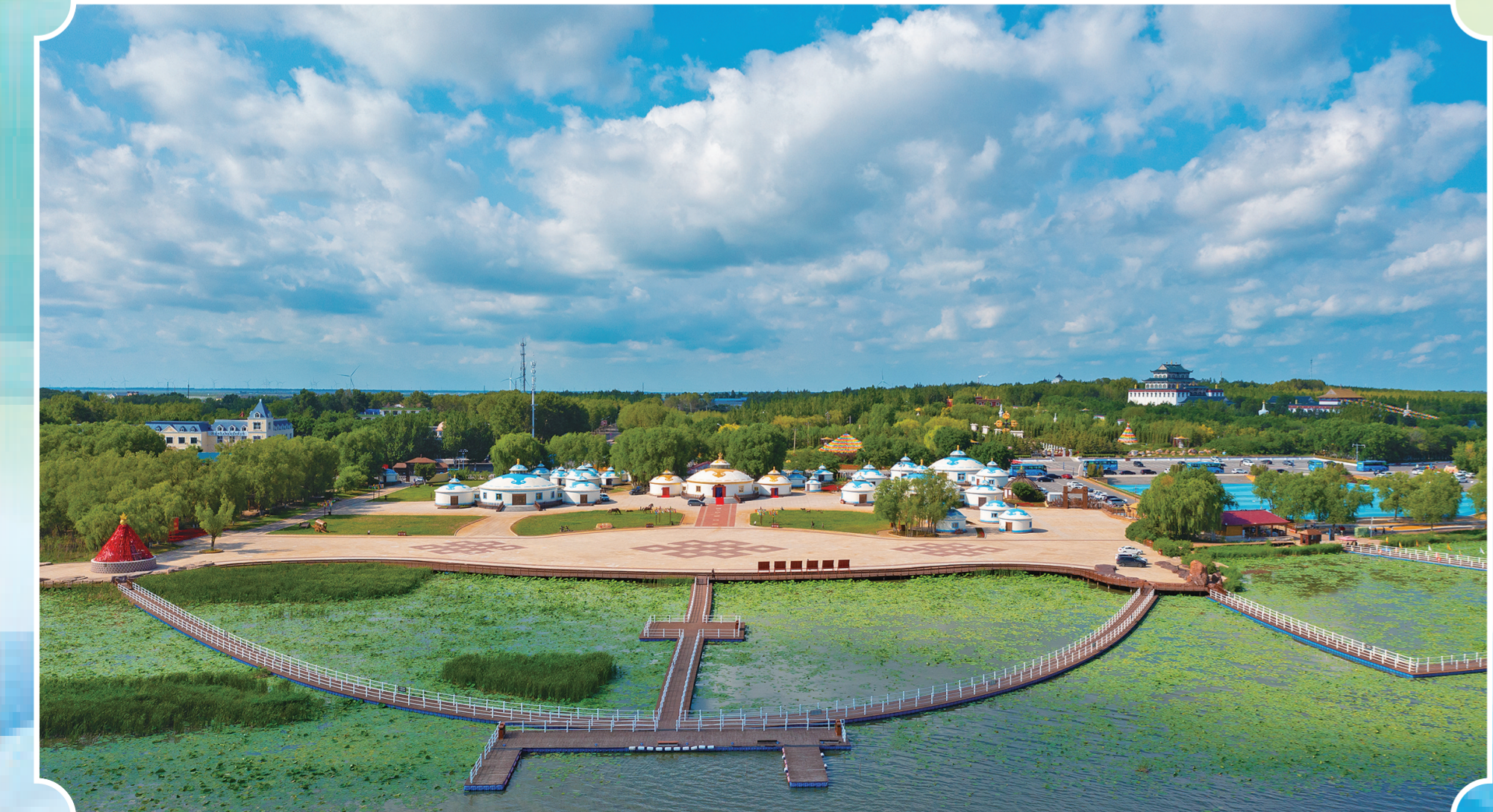
夏日查干湖风景如画。