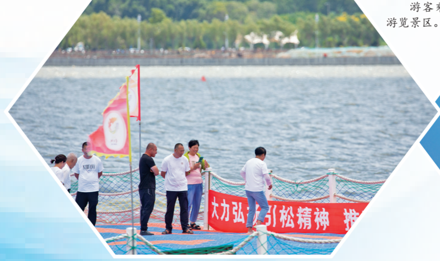
自然好风光吸引游客接踵而至。