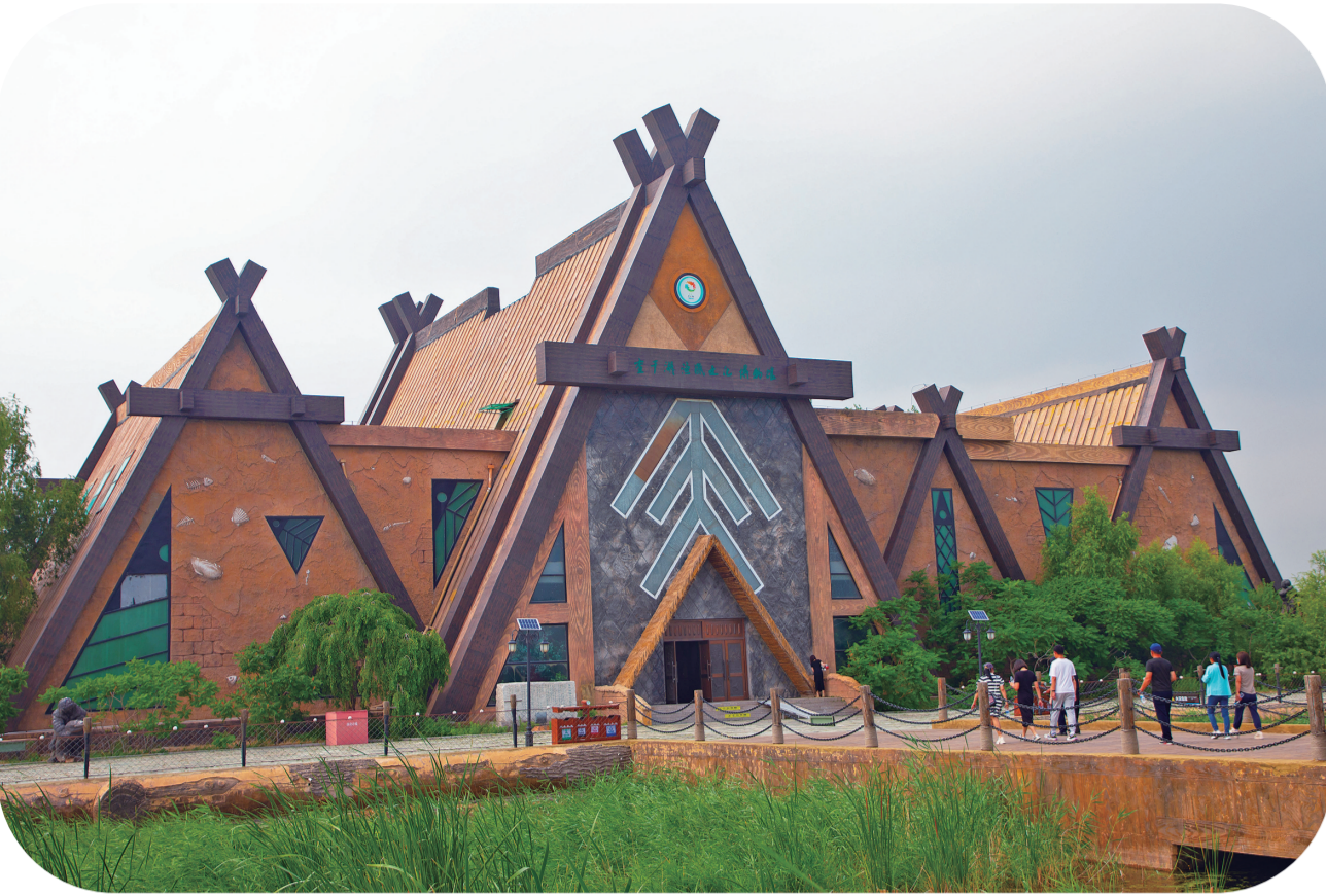
查干湖渔猎文化博物馆。