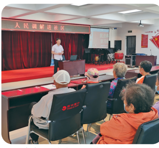
宽城区司法局团山司法所开展人民调解进社区活动。

为发挥商会调解作用,宽城区专门成立了总商会商事纠纷人民调解委员会,派驻1名执业律师加入到调解员队伍中,针对企业需求开展“订单式”法律服务。