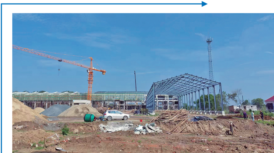
吉林省中景阿润农业有限公司3000万穗鲜食玉米项目正在建设中。项目建成后,预计年实现销售收入0.3亿元,安置就业150人。

探索多元发展模式,以土地股份合作社为基础,探索连股连责、村企联建、产业带动、三产融合、村村联合等发展模式,肖家乡王家村、三井子镇八井子村、弓棚子镇季家村、永平乡九连山村已租具规模,进一步为全市村党支部领办合作社发展提供新样板。