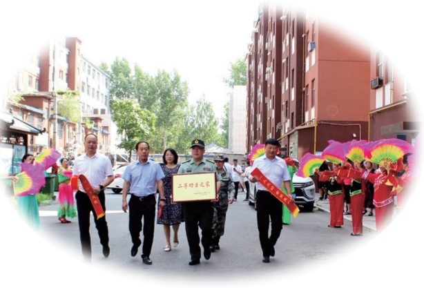
柳河县军地领导给立功受奖家庭送喜报。

柳河县始终牢记“拥军优属、拥政爱民”的光荣传统,用心、用情、用力谱写军政军民团结新篇章。