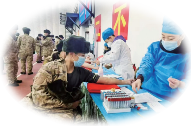
驻白城部队官兵踊跃参与无偿献血。

今年5月举办了军地青年联谊会,军地20余对男女青年牵手成功,为单身官兵婚恋问题提供了新渠道。6月18日,白城市双拥办与白城师范学院走进驻白城演训某部,200余名演职人员演出了15个文艺节目。7月20日,开展了“双拥白城、致敬模范”系列推介会,命名39家“十佳双拥单位”,38名“最美双拥人物”,29名“最美军嫂”和35名“最美退役军人”,通过一系列活动形成了“一人参军全家光荣”的良好社会风气。